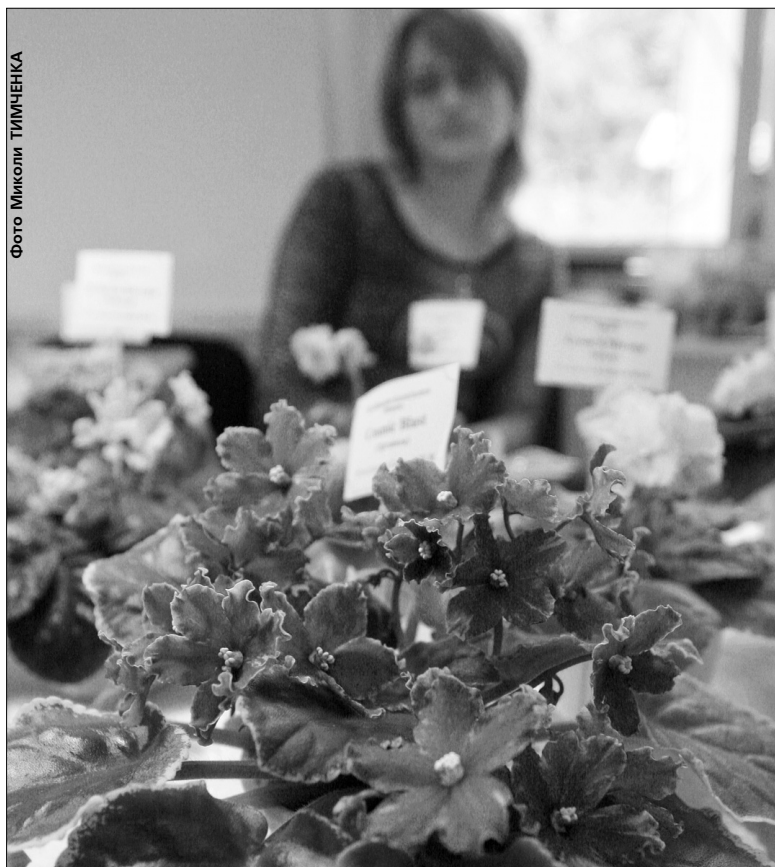
На виставці представлено понад 200 сортів фіалок

У Київському будинку природи відкрився осінньо-зимовий сезон показів кімнатних фіалок