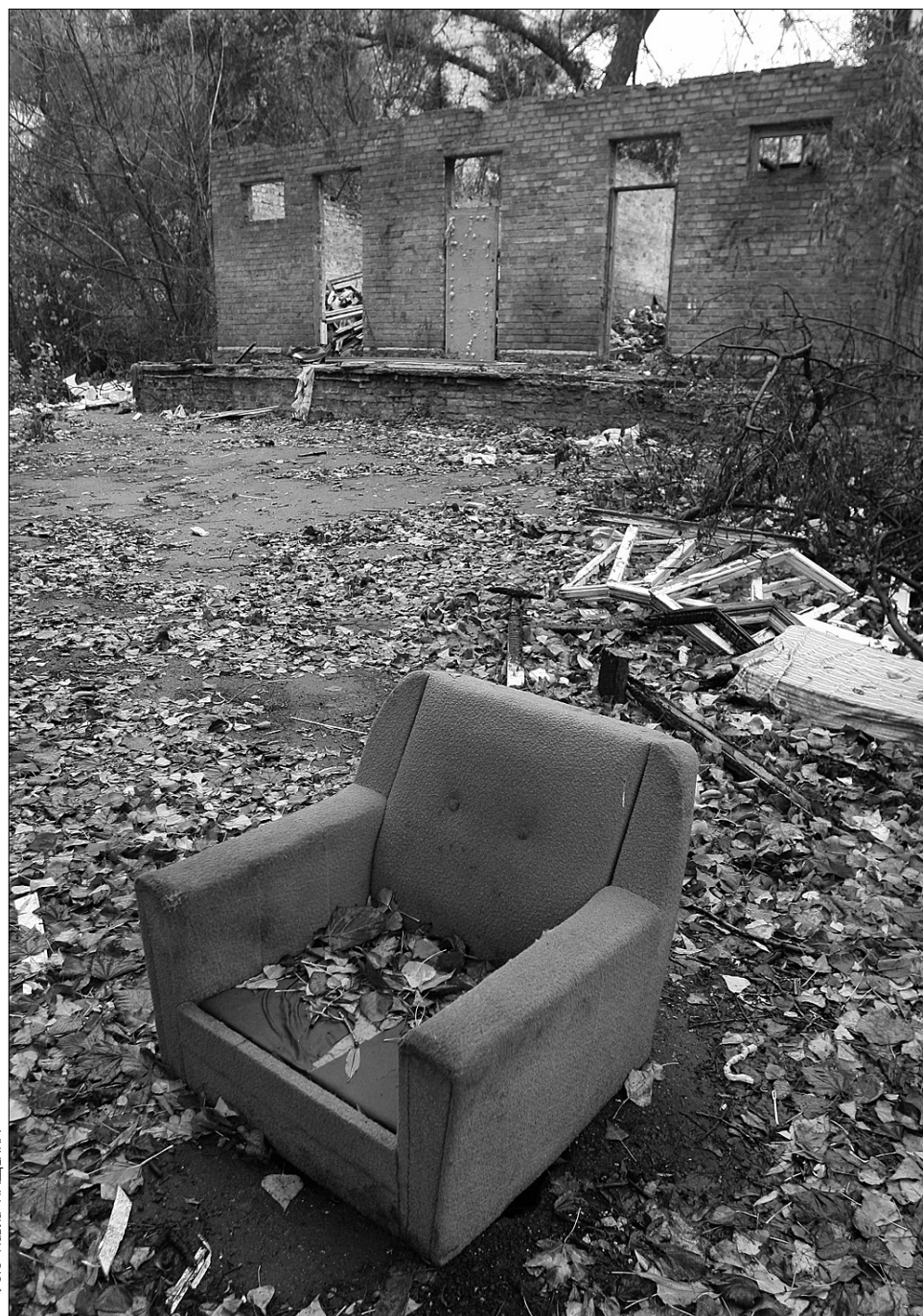
Багато дитсадків міста не лише використовують не за призначенням, а й перебувають у занедбаному стані

Тож бачимо, що хоч і є намагання якось вирішити питання нестачі місць у дитсадках, але ці намагання не дають відповіді багатьом батькам, яким не вдалося знайти місце в дошкільному закладі своїй дитині ●