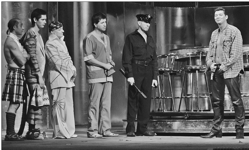
Сцена із спектаклю «Ladies night. Тільки для жінок» Ентоні МакКартена та Стівена Сінклера

Донецький музично-драматичний театр — традиційний обласний театр, де показують музичні, хореографічні та драматичні спектаклі. Під одним дахом тут працюють як артисти драми, так і музиканти (у штаті театру 23 артисти-вокалісти, 12 пар артистів балету, оркестранти і кілька балетмейстерів, хормейстерів і диригентів). Самостійного драматичного театру в місті немає. Є Донецька опера, та в ній іде класика. Власне Донецька музична драма тим і відрізняється від оперного театру, що переважно тут звертаються до синтетичних жанрів, а також музику. Репертуар театру рідкісним чином збалансований між