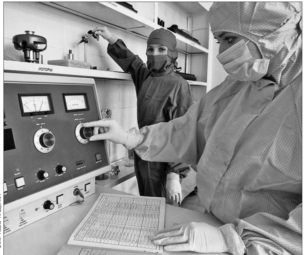
Уже з кінця вересня столичні медики розпочнуть масову вакцинацію проти сезонного грипу

Однак уже незабаром про загрози вірусів варто подбати всім. Цього року очікують щонайменше дві хвилі епідемії грипу. "Першу — десь у двадцятих числах грудня, на початку січня, другу — в лютому-березні", — попередив експерт. До слова, сильні морози взимку, якими сніпотики лякають уже тепер, не будуть основним фактором захворюваності. Все залежатиме від вологості. Якщо буде сухо, то навіть низькі температури не становитимуть аж надто серйозних небезпек. Та