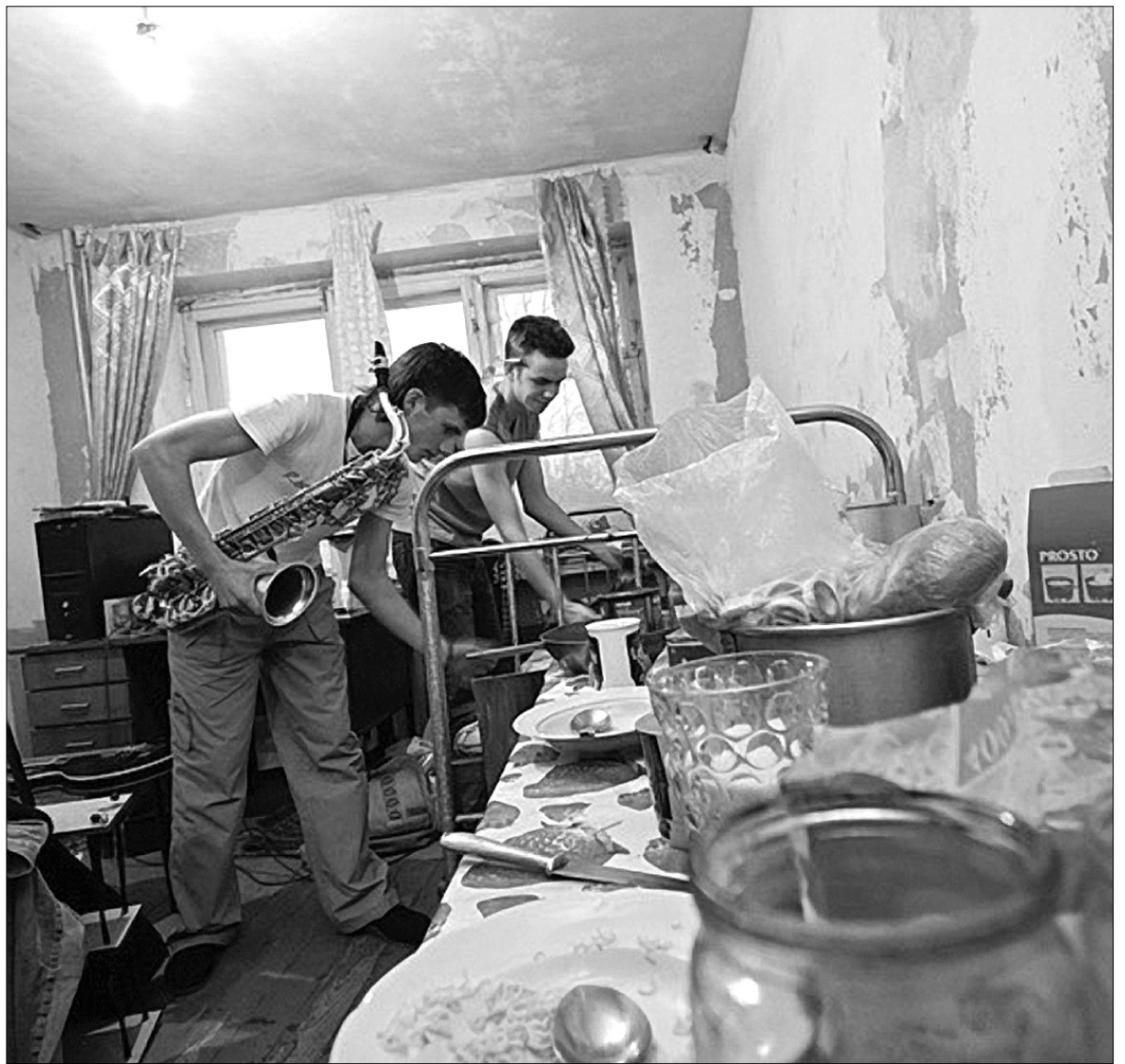
Для багатьох іногородніх студентів питання житла залишається найактуальнішим

Проте тим студентам Могилянки, яким пощастило проживати в гуртожитку, також несолодко. Адже їм щоденно доводиться їздити до місця навчання майже через увесь Київ: із Троєщини і Ворзеля, де знаходяться гуртожитки, на Контракткову площу. А чи будуть гурто-