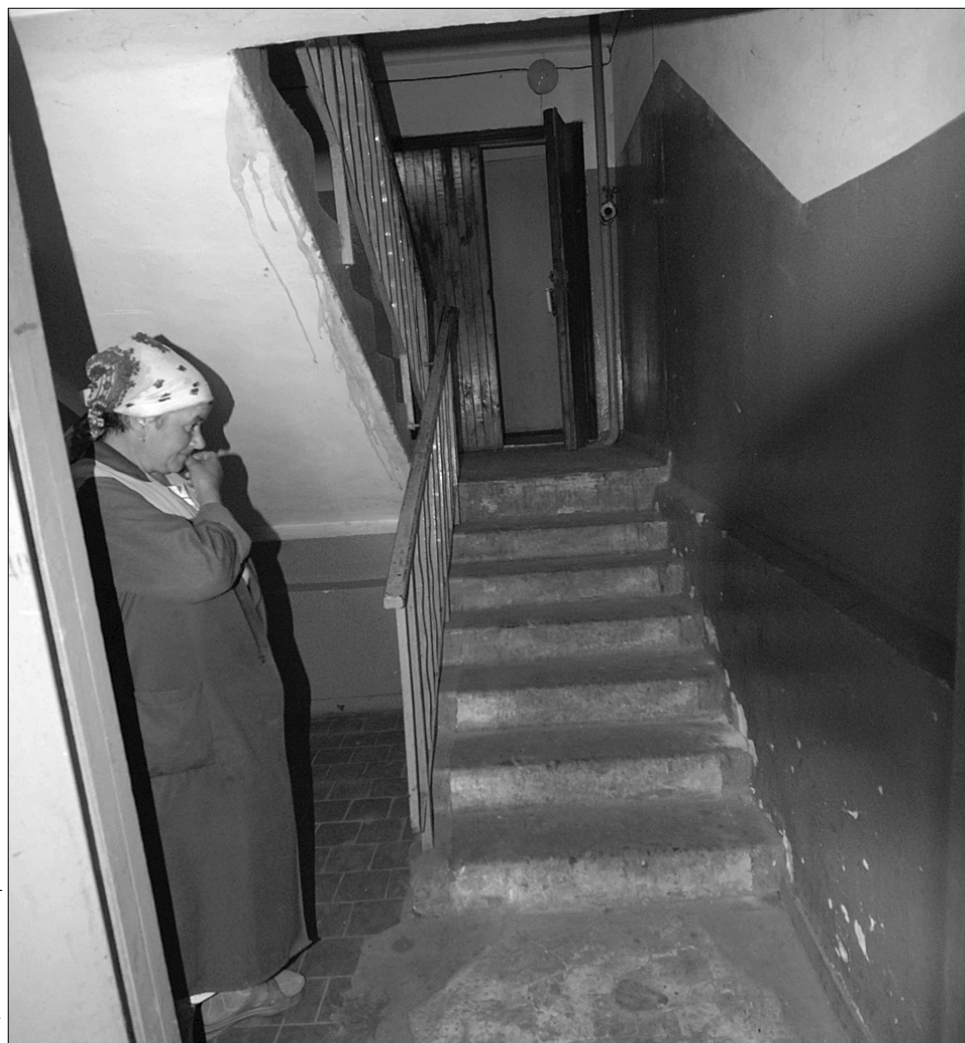
Багато скарг від жителів багатоповерхівок надходить з приводу незадовільного стану під'їздів

Скаржаться мешканці столиці й на самовільно встановлені МАФи, несанкціоновану торгівлю. На жаль, і тут Святошинський район упевнено лідирує як найгірший. Саме звідси надійшла п'ята частина загальної кількості скарг ●