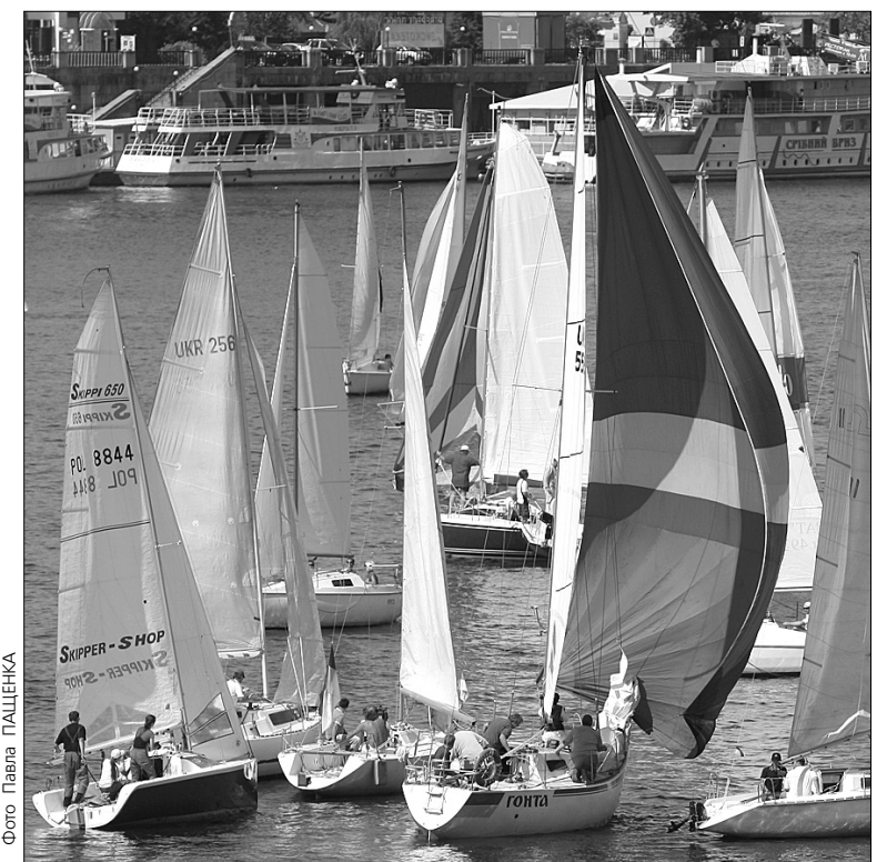
Одним з найвидовищніших заходів стала регата з вітрильного спорту серед крейсерських яхт