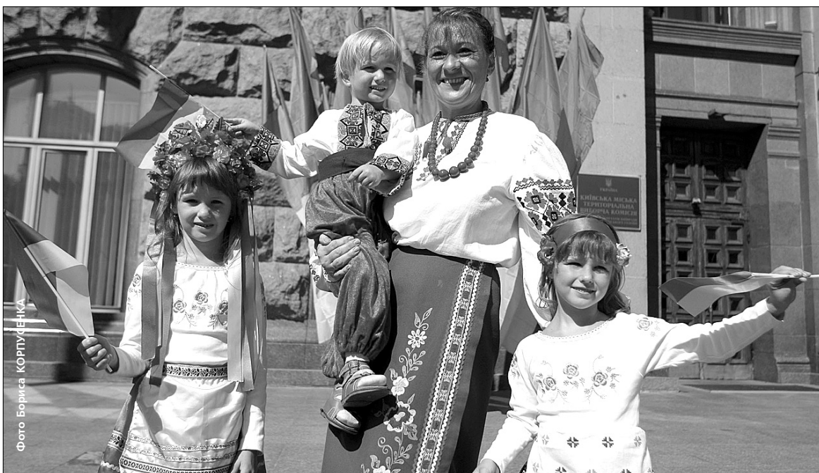
Разом з батьками у святкових заходах взяли участь і наймолодші кияни