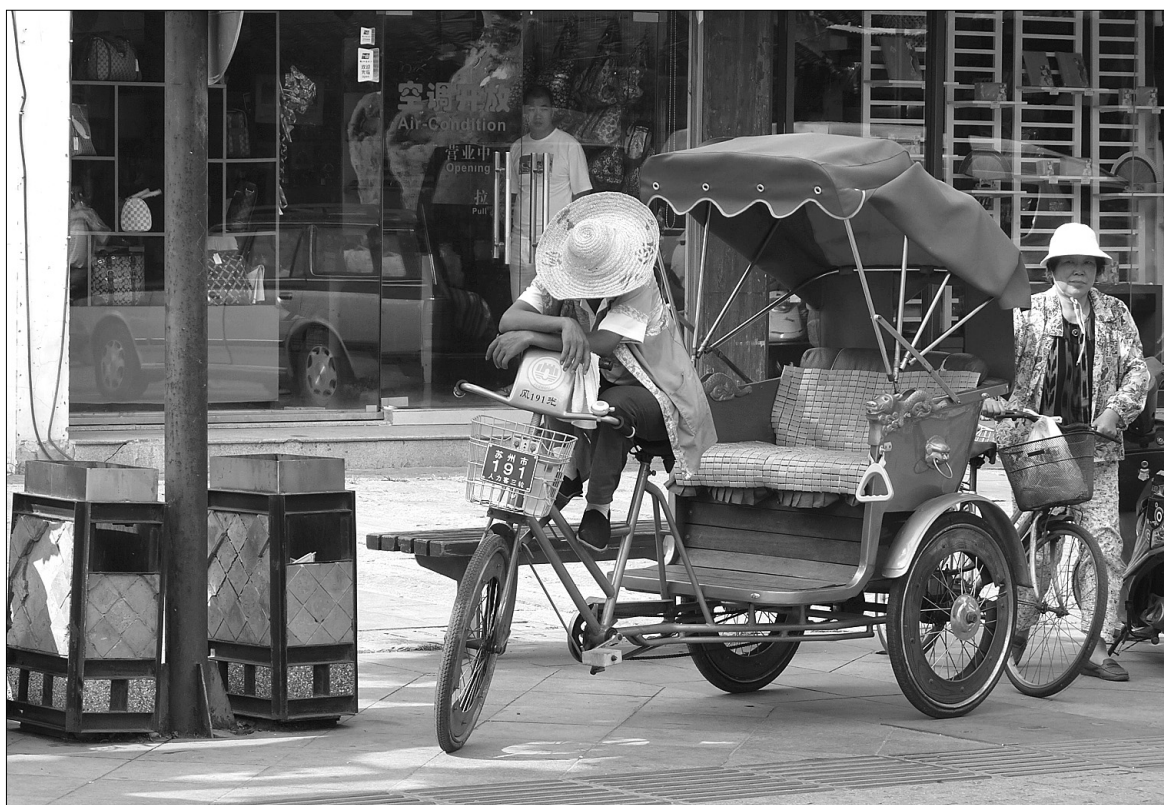
Велорікша — екологічно чистий засіб пересування