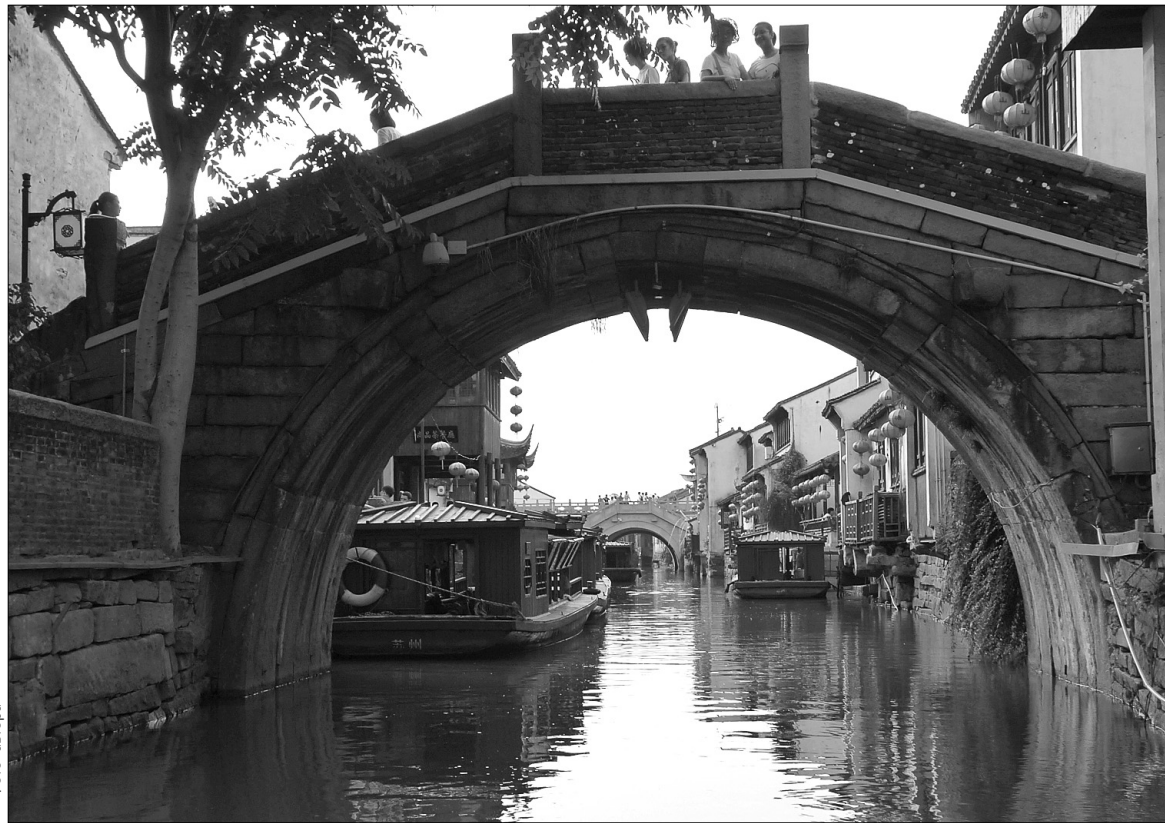
Канали Сучжоу нагадують декорації до кримінальних комедій Джекі Чана

Найбільший з міських паркових ансамблів, що як культурна спадщина охороняється ЮНЕСКО, — "Сад скромного чиновника". У 1513 році його облаштував відставний цензор. Після його смерті син за одну ніч програв батьківський сад. Китайці — дуже азартні гравці. Усі 14 годин, які ми летіли з Москви до Шанхаю, китайські су-