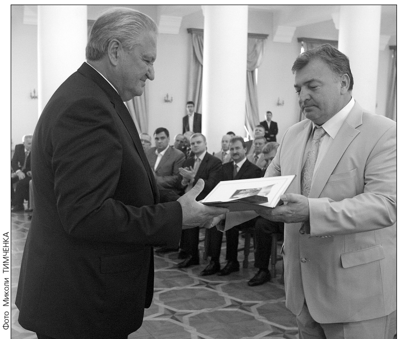
На честь 19-ї річниці Незалежності України 30 найдостойніших киян отримали в мерії ордени, медалі, почесні звання