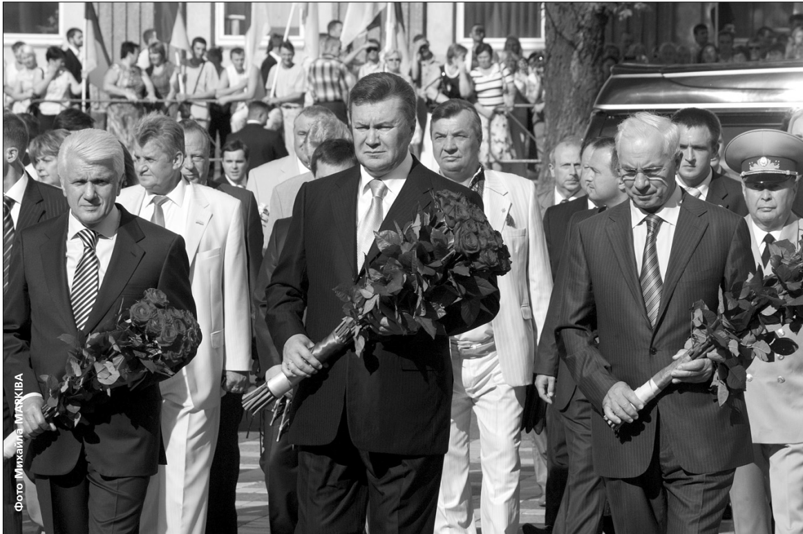
У рамках святкування Дня Незалежності керівники держави й уряду поклали квіти до пам'ятника Михайлові Грушевському

сіоналізм людей, які робили квіткові композиції, адже в кожному з них закладено глибоку національну ідею. Як на мене, ідея ця — об'єднання України, адже вишитий рушник символізує автентичність і патріотичний дух кожного з регіонів держави". Завершилося святкування Дня Незалежності святковим концертом на головній площі столиці та феєрверком ●