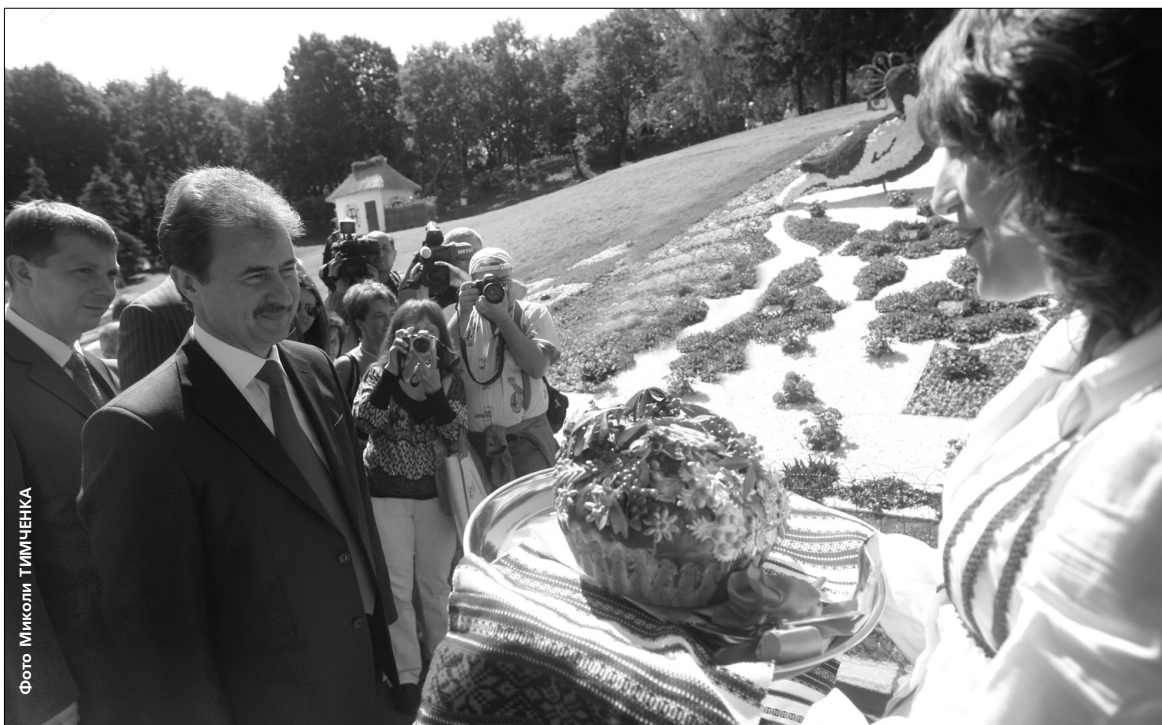
Темою ювілейної виставки квітів стала «Ріка вишиванок»