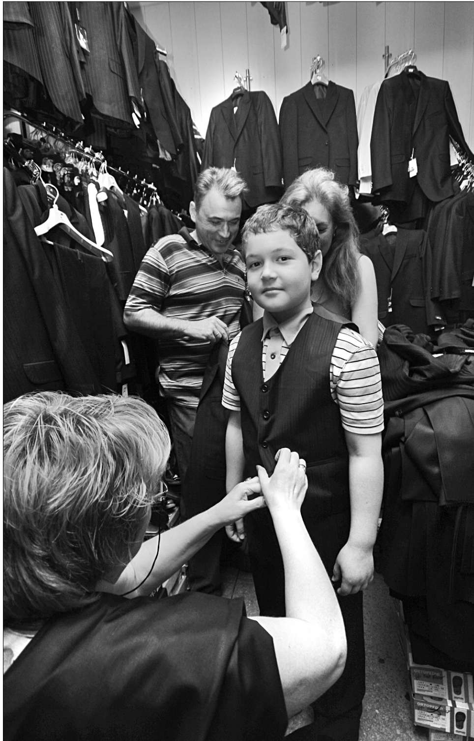
У спеціалізованих магазинах та на шкільних базарах батьки можуть придбати учнівську форму як в комплекті, так і поштучно

Дещо демократичніші ціни на спортивні костюми. Вони стартують від 90 гривень. За фірмові, з цупкої, схожої на плащову, тканини треба віддати в середньому 500 грн. Можна "схитрувати" і купити окремо доброї якості штани і реглан (київської трикотажної фабрики) за 150-180 грн.