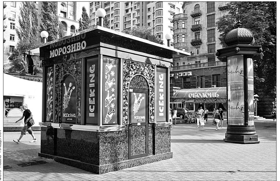
За два роки столична влада впорядкує схему розміщення МАФів, з яких нині лише десята частина встановлена у місті без порушень

Нині райдержадміністрації проводять інвентаризацію усіх малих архітектурних форм. Точно визначити, скільки їх по місту, складно, а приблизно — 20 тисяч. З них власники тільки 2800 сплачують за землю, 11 тисяч мають дозвіл, значну частину яких видано з порушенням чинного законодавства, інші ж кіоски встановлено абсолютно самовільно. «Всі ці МАФи ми не можемо просто так взяти і