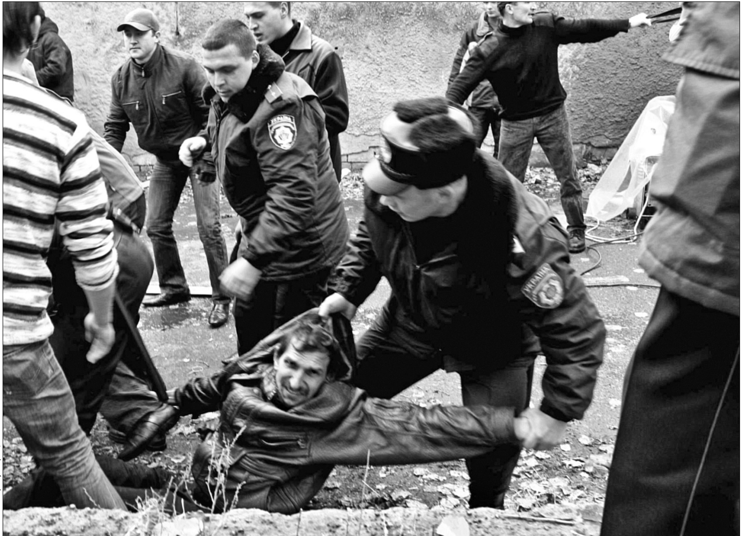
Сьогодні столичним правоохоронцям у роботі допомагають понад 7,5 тисячі добровільних помічників

патруля". Існують наймані охоронці, які на "зручні" для начальника речі закривають очі, а також на те, що відбувається за два метри від їхнього робочого місця. Це стосується і організацій та установ. "Якому чиновникові хочеться, щоб його контролювали, — риторично запитує пан Пономарьов, — адже саме функції контролера, а не помічника, потрібно сьогодні надавати народному дружинникові. Охорона громадського порядку — це ще і боротьба з корупцією, в якій сьогодні погрузли державні мужи та міліція. Ось приклад. Кошти на організацію роботи районних штабів з міського бюджету доходять далеко не до всіх райдержадміністрацій. Лише п'ять районів з десяти — Голосіївський, Оболонський, Печерський, Подільський, Святошинський — відчують реальну державну підтримку. Куди діваються гроші для інших, а Деснянський не отримував їх 1,5 року, лишається тільки здогадуватися". Як доказ керівник Деснянського районного штабу надав офіційний звіт про роботу міського громадського формування за півріччя. Навпроти графі "отри-