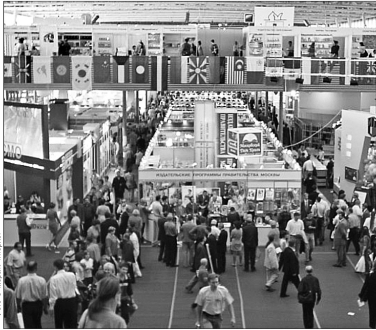
Представники видавництв України, Білорусі, Болгарії, Ізраїлю, Польщі, Угорщини, Індії, Туреччини візьмуть участь у VI Київському книжковому ярмарку