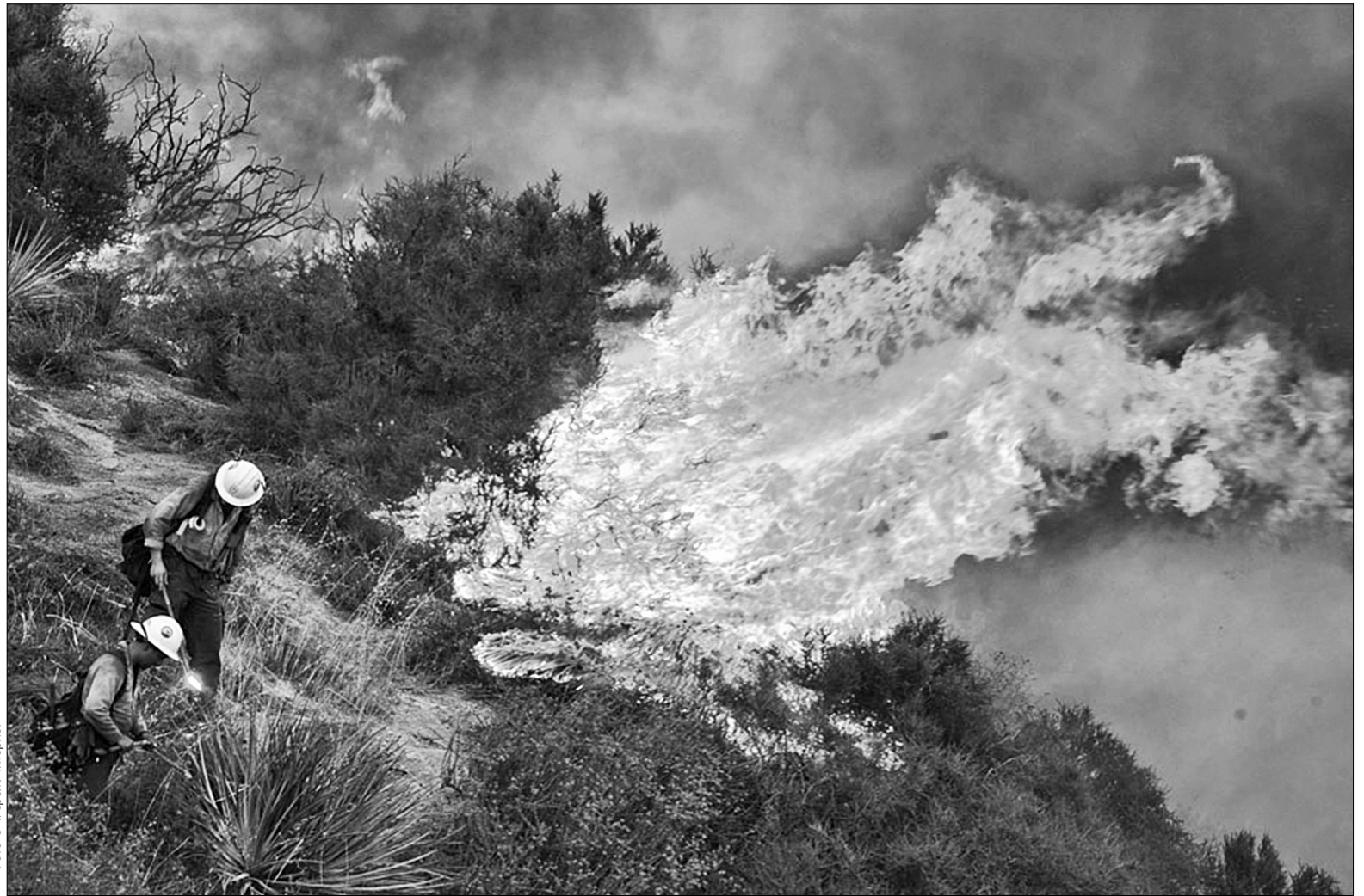
Головними причинами пожеж фахівці називають необережне поводження з вогнем і порушення правил монтажу та експлуатації електроприладів

Ще зі шкільних парт дітей вчать у разі пожежі телефонувати за номером 101. Та, на жаль, і не всі дорослі завжди знають, як уберегтися від вогняного лиха. Часто керівники підприємств, де ймовірність виникнення пожежонебезпечної ситуації надто висока, про протипожежні заходи починають думати лише після підрахунку матеріальних втрат. Рятувальники ж попереджають: економія на пожежній безпеці — вже небезпечна. Тому насамперед варто подбати про вогнегасники, ящики з