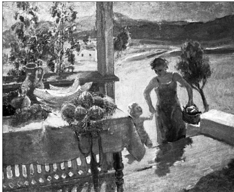
"Жінка з дитиною"

Картини Глущенко зберігаються в київському архіві-музеї з 1979 року. Майже півсотні полотен закладу подарували вдова та брат художника. Тут діє меморіальна кімната-музей Глущенко, де експонуються окремі його роботи.