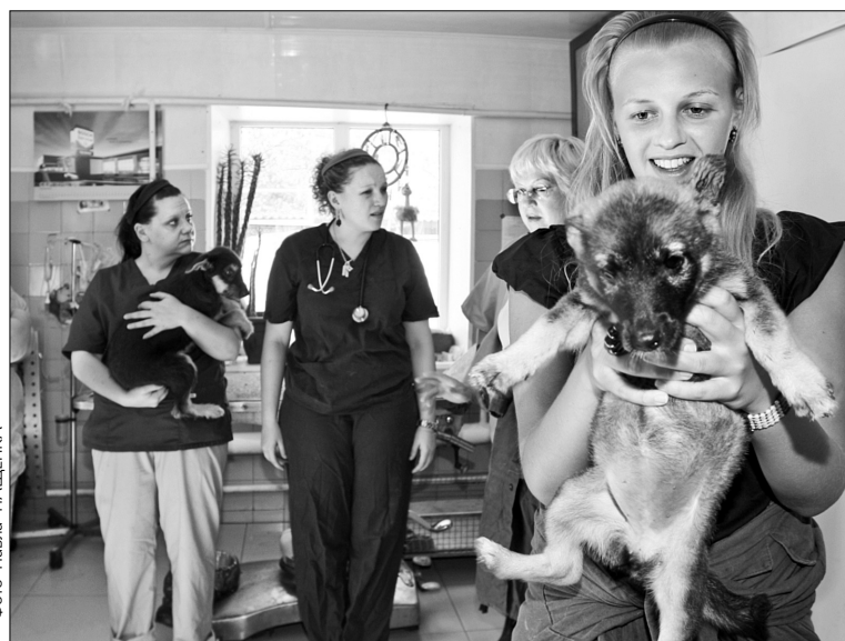
Завдяки дотаціям, шанс отримати перше робоче місце з’явиться, серед інших, у ветеринарів

Цьогоріч для молодих спеціалістів з’явилася і добра новина: випускникам вищих навчальних закладів держава надає додаткові гарантії щодо працевлаштування за здобутим фахом на заброньовані та додаткові робочі місця з наданням дотації роботодавцю. У державному бюджеті 2010 року на це передбачено 10 млн грн. Якщо компанія приймає на роботу молодого спеціаліста з ініціативи