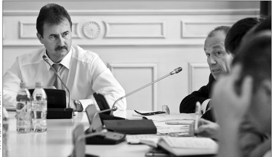
Виконувач обов'язків міського голови Олександр Попов наголосив, що Київ має ввійти до двадцятки чи навіть десятки найкращих міст світу

А мета в усієї команди одна: Київ має ввійти до двадцятки чи навіть десятки найкращих міст світу. Принаймні на цьому наголосив головуючий на засіданні виконувач обов'язків міського голови Олександр Попов. "Наміри дуже амбіційні, але це можливо", — сказав Попов. Для того, щоб наміри справді були реалізовані, Стратегію розвитку міста хочуть прописати до найдрібніших деталей, із