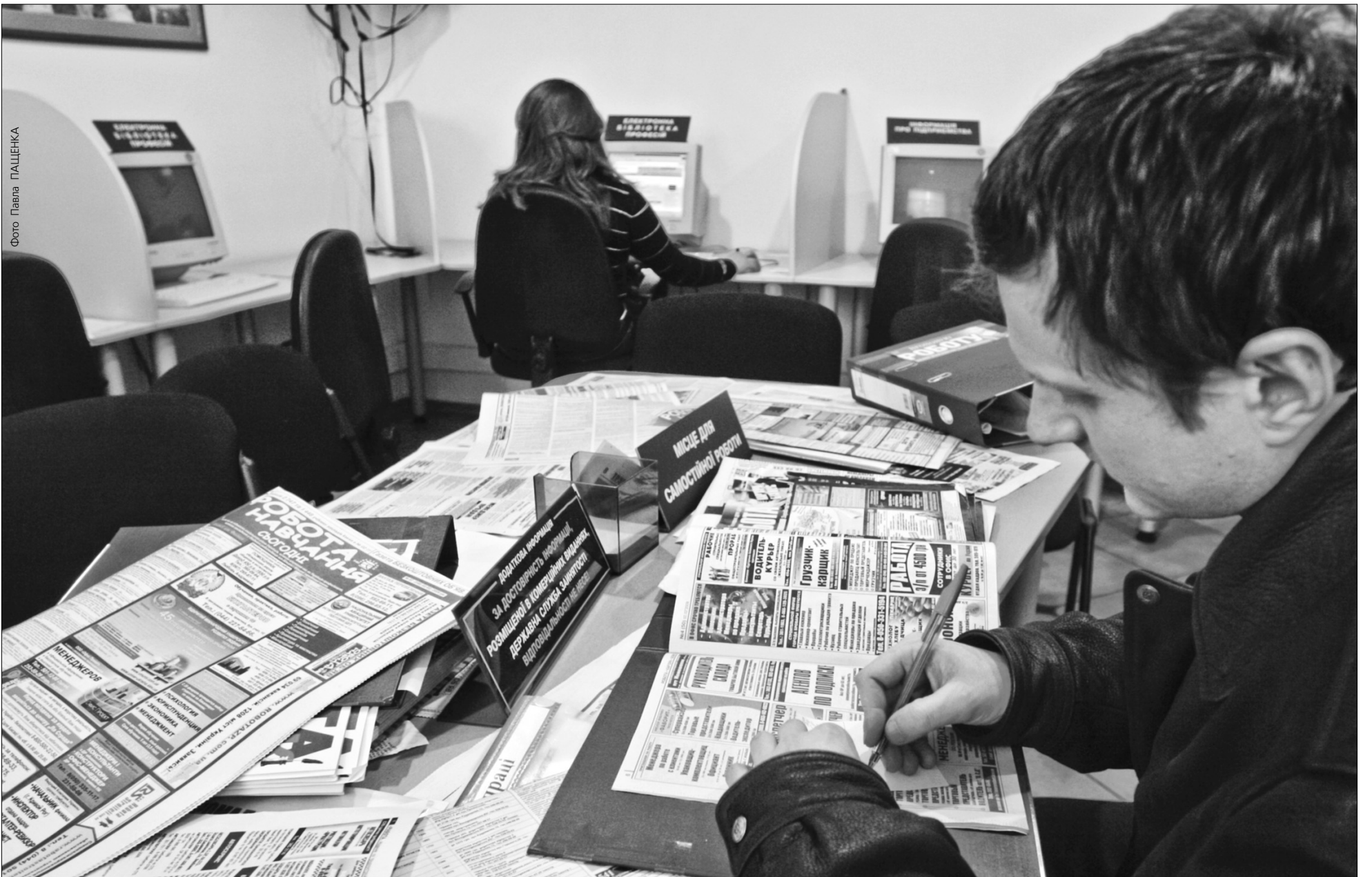
Стандартна умова успішного працевлаштування — досвід роботи від двох років — "глухий кут" для багатьох випускників

Безробіття молоді спробують подолати дотаціями