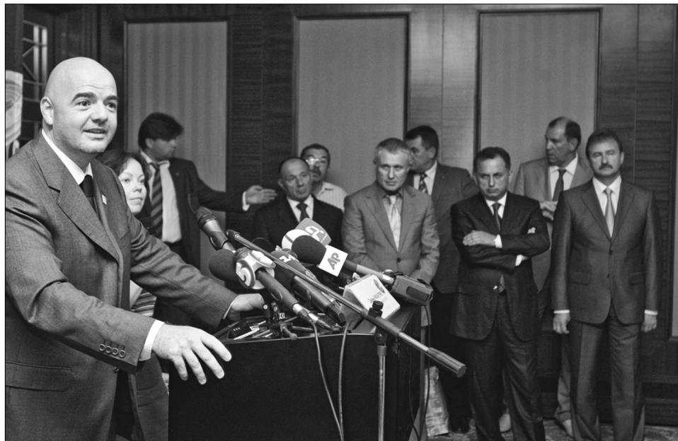
Джанні Інфантіно схвально оцінив динаміку підготовки України і Києва до футбольного чемпіонату Євро-2012

Учора Київ відвідала делегація експертів УЄФА на чолі з генеральним секретарем цієї футбольної організації Джанні Інфантіно. Візит здійснено в рамках огляду всіх чотирьох українських міст, що 2012 року прийматимуть матчі чемпіонату Європи з футболу. Київ став фінальною точкою “інспектування”. Позавчора пан Інфантіно побував у Львові та Донецьку. Вчора зранку встиг оглянути Харків. Представники УЄФА приїхали до України через кілька місяців після квітневого візиту президента цієї організації Мішеля Платіні. Нині вони збирають інформацію про підготовку до Євро-2012 напередодні засідання наглядової ради. “Ми хотіли подивитися, що відбувається, як виконують обіцянки, і де ми нині є. Це важливо знати напередодні засідання наглядової ради, що відбу-