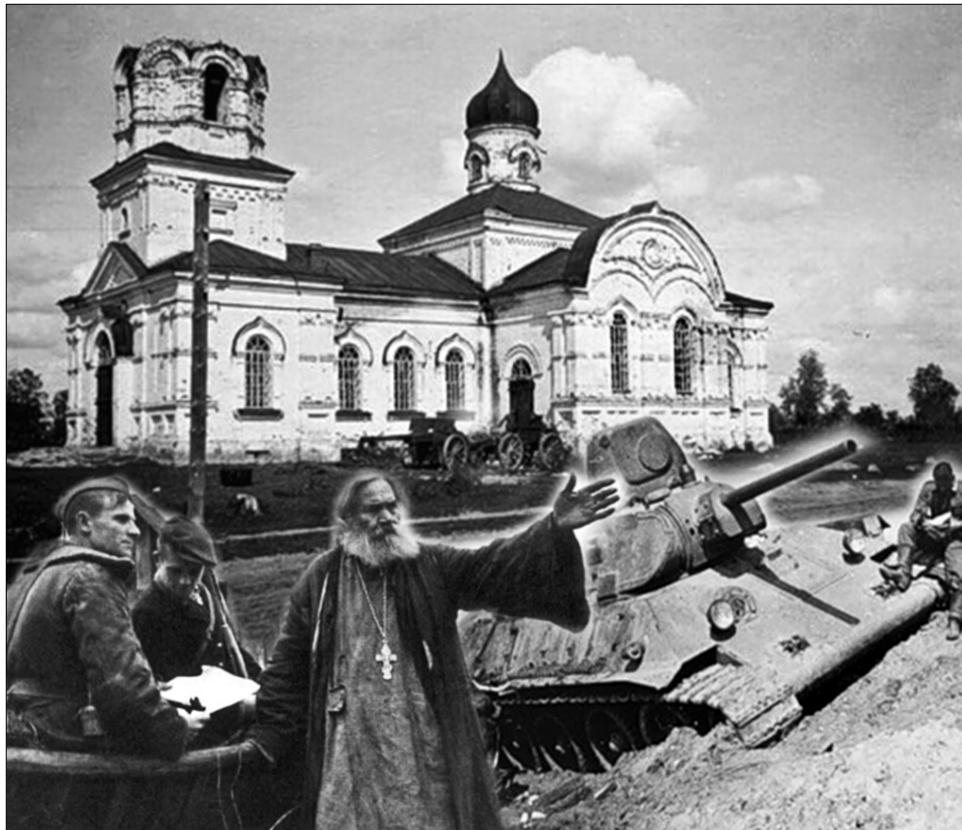
Колаж Наталі Спінкноі

На вчерашнем концерте Варвара отступила от программы. Ей очень захотелось спеть про неразделенную любовь, про надежду, страдания и свет в душе. Все это посвящалось майору, который единственный в целом мире понял ее. И вот она уезжает, а его завтра, возможно, убьют. Грузовики дружно увозили артистов с передовой, а душа ныла, и чем дальше, тем невыносимее. В конце концов, в жизни Вар-