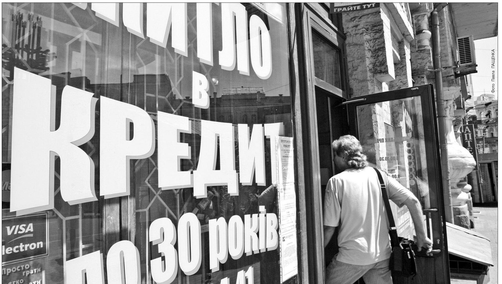
Кредит у половину життя — чи не єдиний реальний шанс мати власне житло в столиці

Квадратний метр столичного житла коштує 4 середньомісячні зарплати киянина