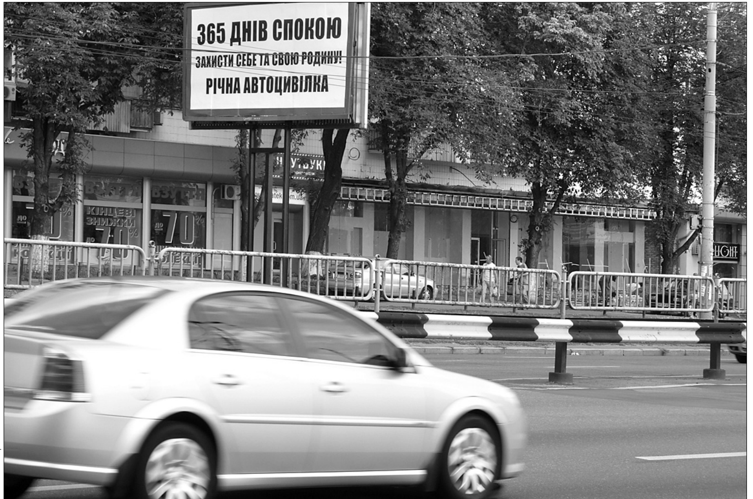
Спокій власнику авто забезпечить лише той договір, у якому немає прихованих спеціальних умов

Деякі СК не визнають страховим випадком (а отже, і не виплачують за ним компенсації) "падіння з транспортного засобу вантажу, обладнання і запчастин, потрапляння предметів, які вилетіли з-під коліс транспортного засобу". Тому, простіше кажучи, якщо вам на трасі розбив