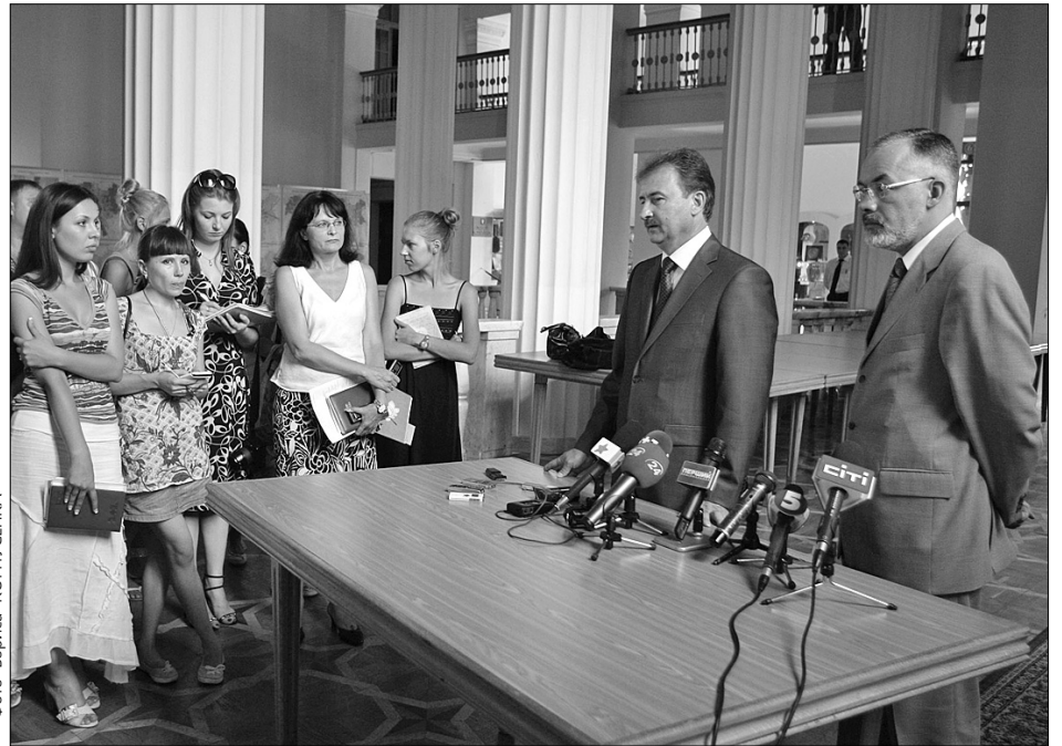
У нараді з підготовки столичних закладів освіти до нового навчального року взяли участь виконавчач обов'язків голови КМДА Олександр Попов і міністр освіти Дмитро Табачник

За словами заступника головного державного лікаря Київської СЕС Юрія Жигалова, відповідно до перевірки, низка