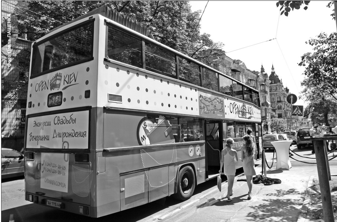
Віднедавна ознайомитися з визначними пам'ятками столиці можна, подорожуючи двоповерховим туристичним автобусом