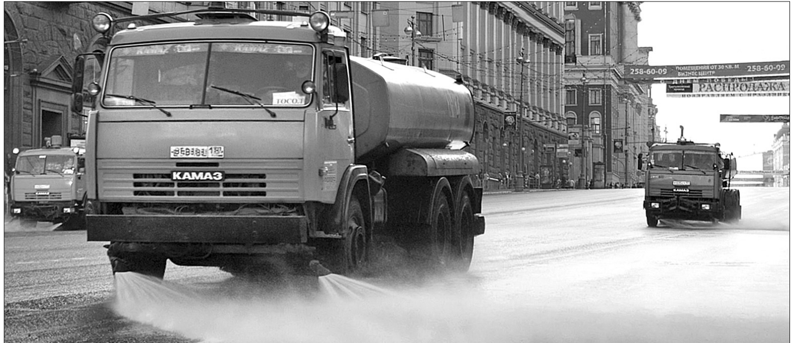
Через нестерпну спеку столична влада розпорядилася щодня поливати міські вулиці й парки

Згідно з документом, насамперед охолоджувати мають ті місця, де люди перебувають у розпал спеки. А це переважно на роботі. Керівники установ, організацій, підприємств мають забезпечити умови праці, що відповідають нормам санепідемстанції — температура в