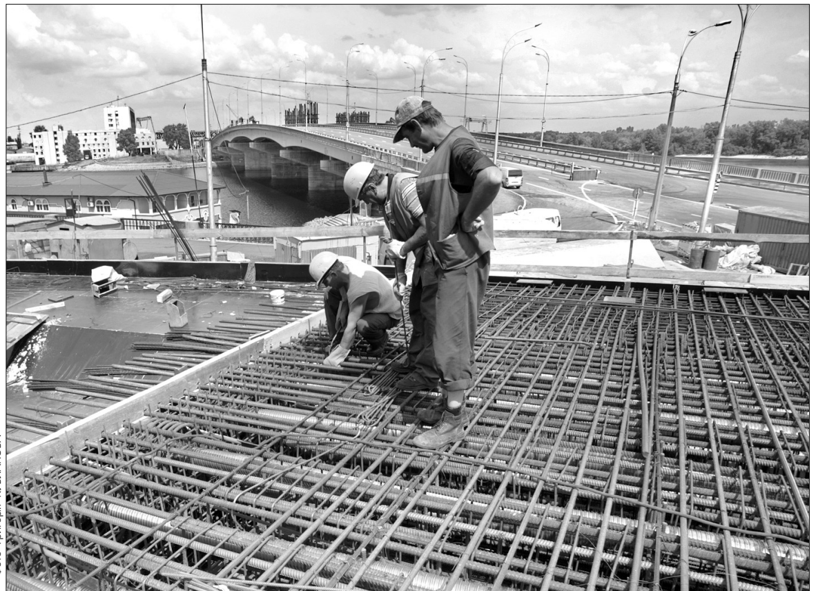
Нині мостобудівці завершують спорудження естакади Гаванського мосту