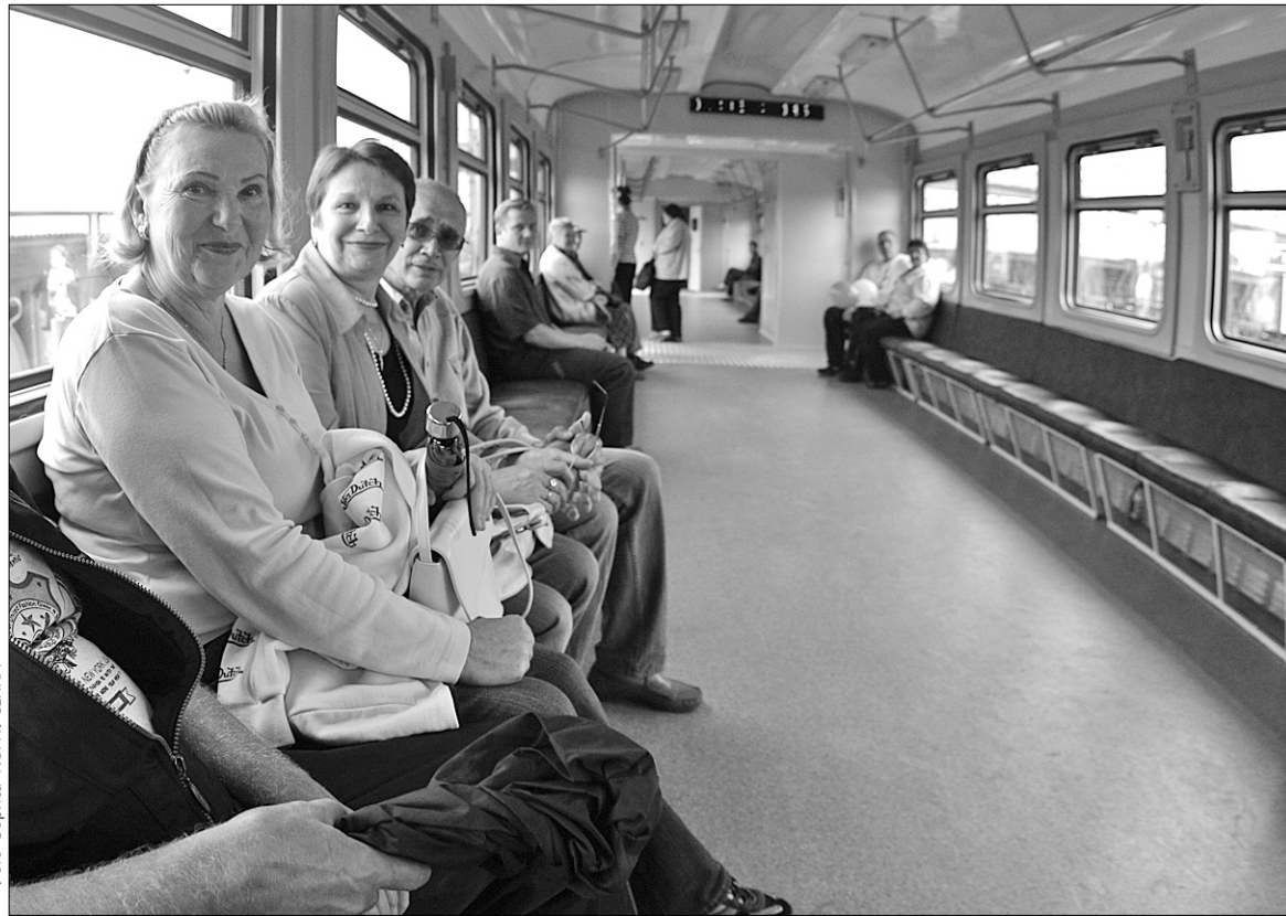
До кінця року на карті Києва з'являться ще дві зупинкові платформи міської електрички

Нинішнього року в столиці планується продовжити роботи з будівництва нових станцій міської електрички. Зокрема передбачено ввести в експлуатацію зупинкові платформи наступної черги — "Сирець" і "Борщагівська". Про це повідомили в КП "Київпаstrанс", який є замовником виконання робіт. Окрім цього, вже до кінця 2010 року заплановано відкрити рух на перегоні між зупинковою платформою