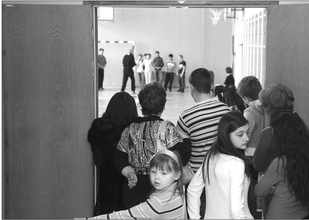
Щоб займатися у спортзалі чи на стадіоні, учням деяких столичних шкіл потрібно сплатити гроші орендарям спортивних об'єктів