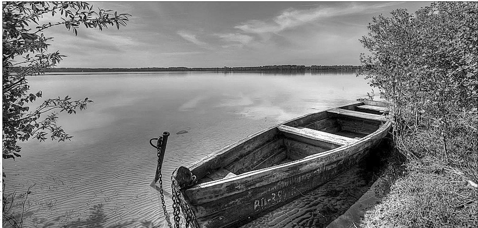
Шацькі озера увібрали у себе всю красу Волинського краю, тому щороку їх відвідують тисячі іноземних та вітчизняних туристів

Так називають Шацький національний парк, площа якого сягає 32,5 тисяч гектарів, а територію, на якій розташовані озера, Шацьким поозер'ям. Легенди свідчать, що колись тут було збудовано фортецю і замок, в якому жив князь. У князя була горда донька-красуня. Коли до фортеці під