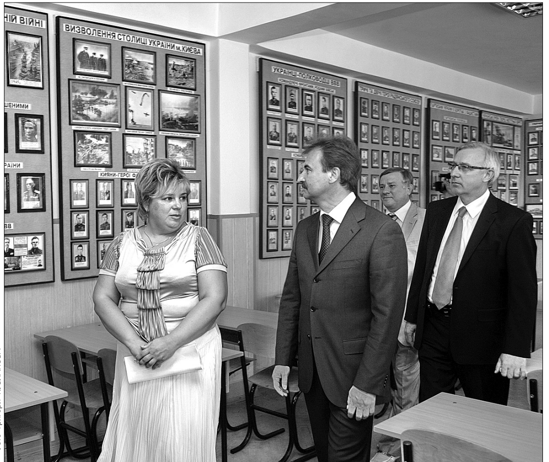
Виконавач обов'язків голови КМДА Олександр Попов розпочав перевірку навчальних закладів з Оболонського району

Аби навчання проходило ще продуктивніше, у школі