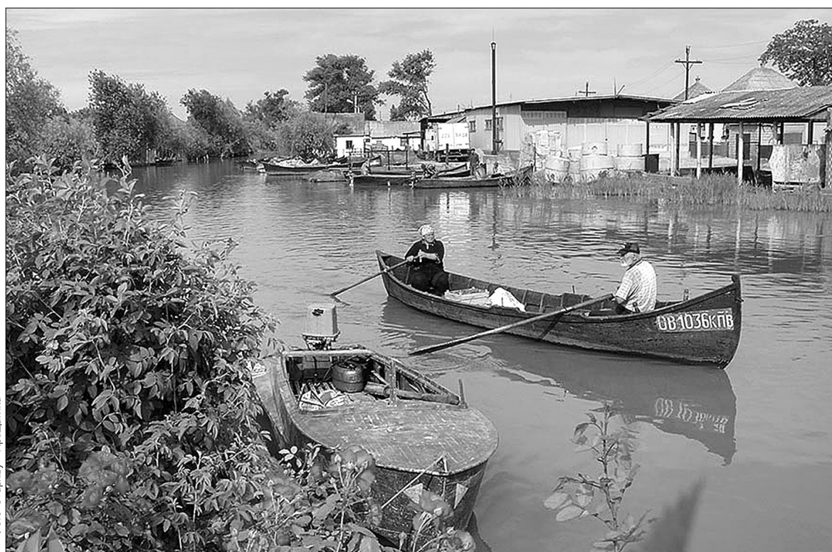
Човни у Вилковому, що на Одещині, виконують роль громадського транспорту

Місцеве населення добродушно зустрічає гостей — пригоща-