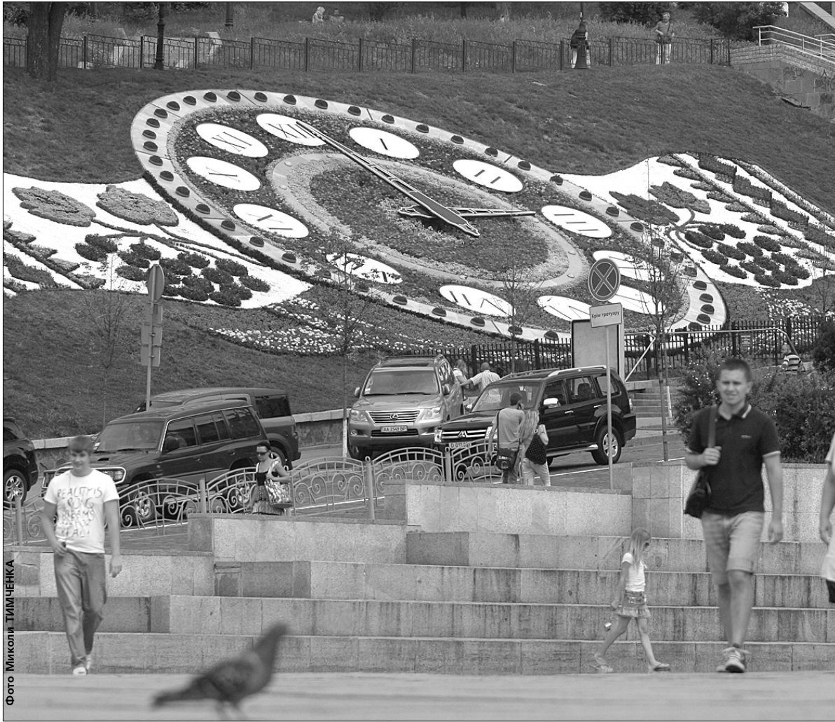
Квітковий годинник, розташований в самому центрі столиці, вважається найбільшим у Європі