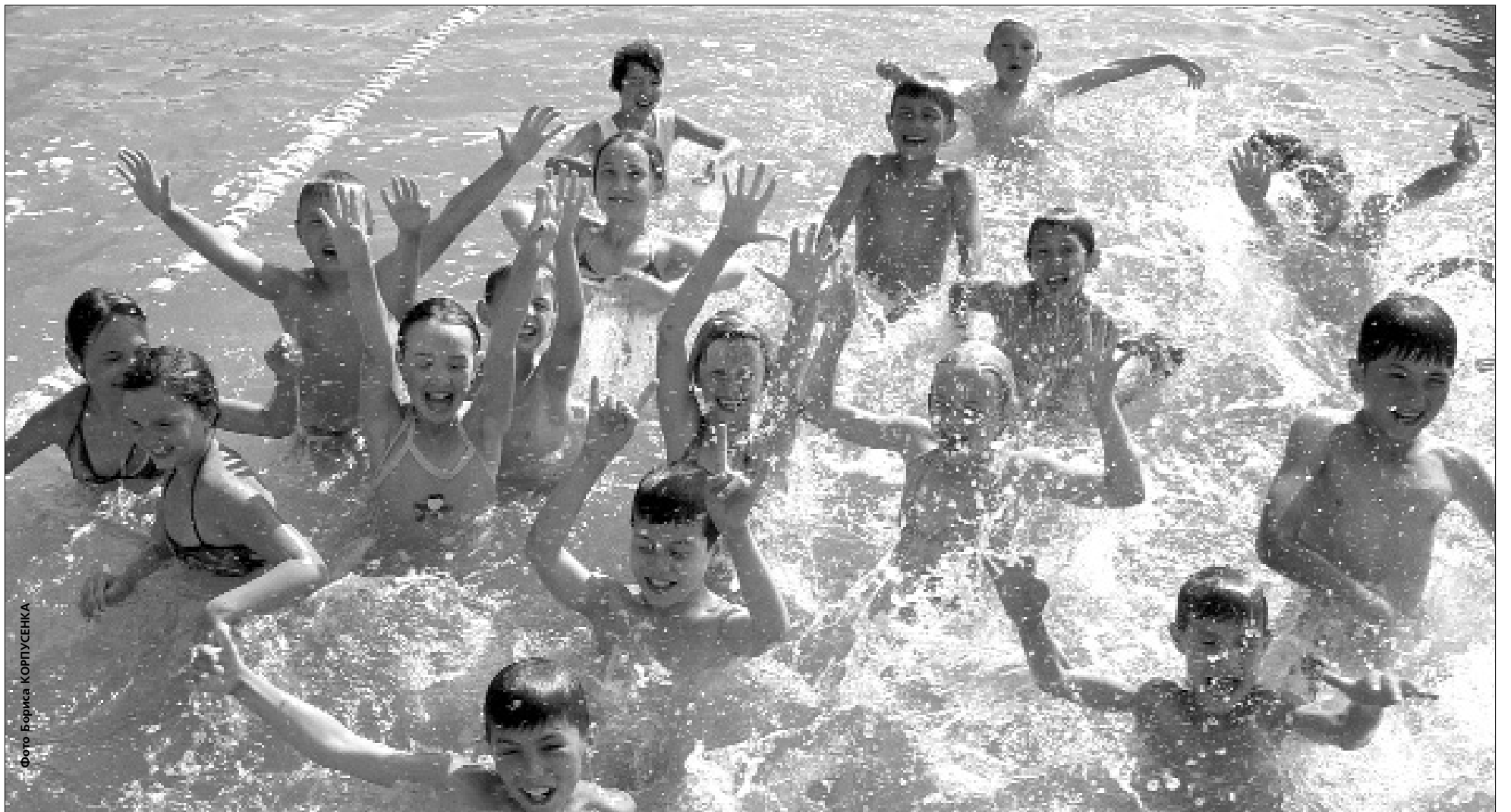
За кошти міського бюджету в різних куточках країни відпочили майже п'ятсот дітей шкільного віку

Міська влада організувала столичним дітям незабутній відпочинок на морі та в горах