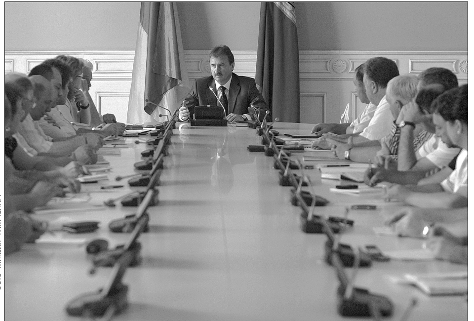
Під час наради в мерії обговорили питання реформування столичної медицини