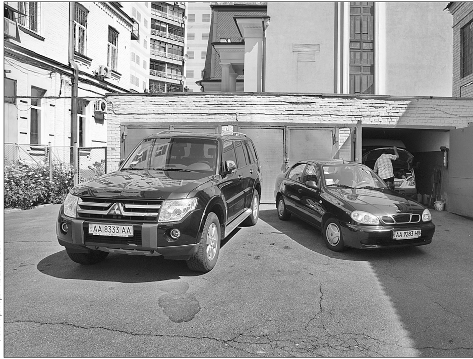
Незаконні гаражі на прибудинковій території — справжнє лихо для мешканців

Наприкінці червня незаконний гараж з'явився поблизу дитячого майданчика неподалік вулиці Народного ополчення, 4-а, що в Солом'янському районі. І що показово, теж уночі. Про це повідомив службу 15-51 місцевий мешканець