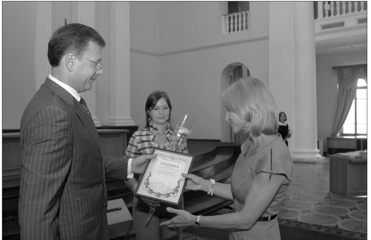
Під час урочистостей в мерії кращі працівники торгівлі отримали відзнаки

У порівнянні з іншими містами Київ має найрозвиненішу мережу магазинів і ресторанів. На кінець