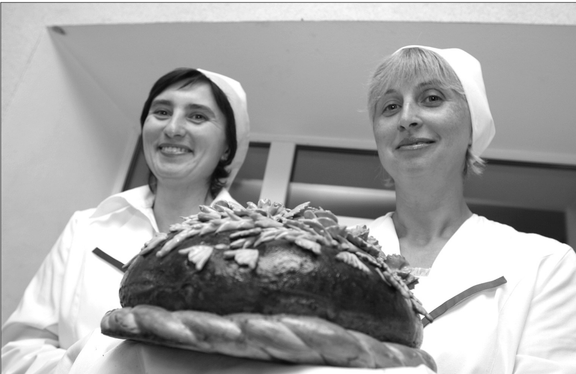
Що може бути смачнішим за теплий духмяний каравай