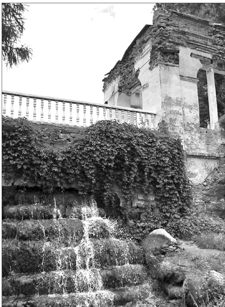
Декоративний елемент парку — Руїни

Загальна площа "Олександрії", що розташована поблизу Білої Церкви, становить понад 200 гектарів