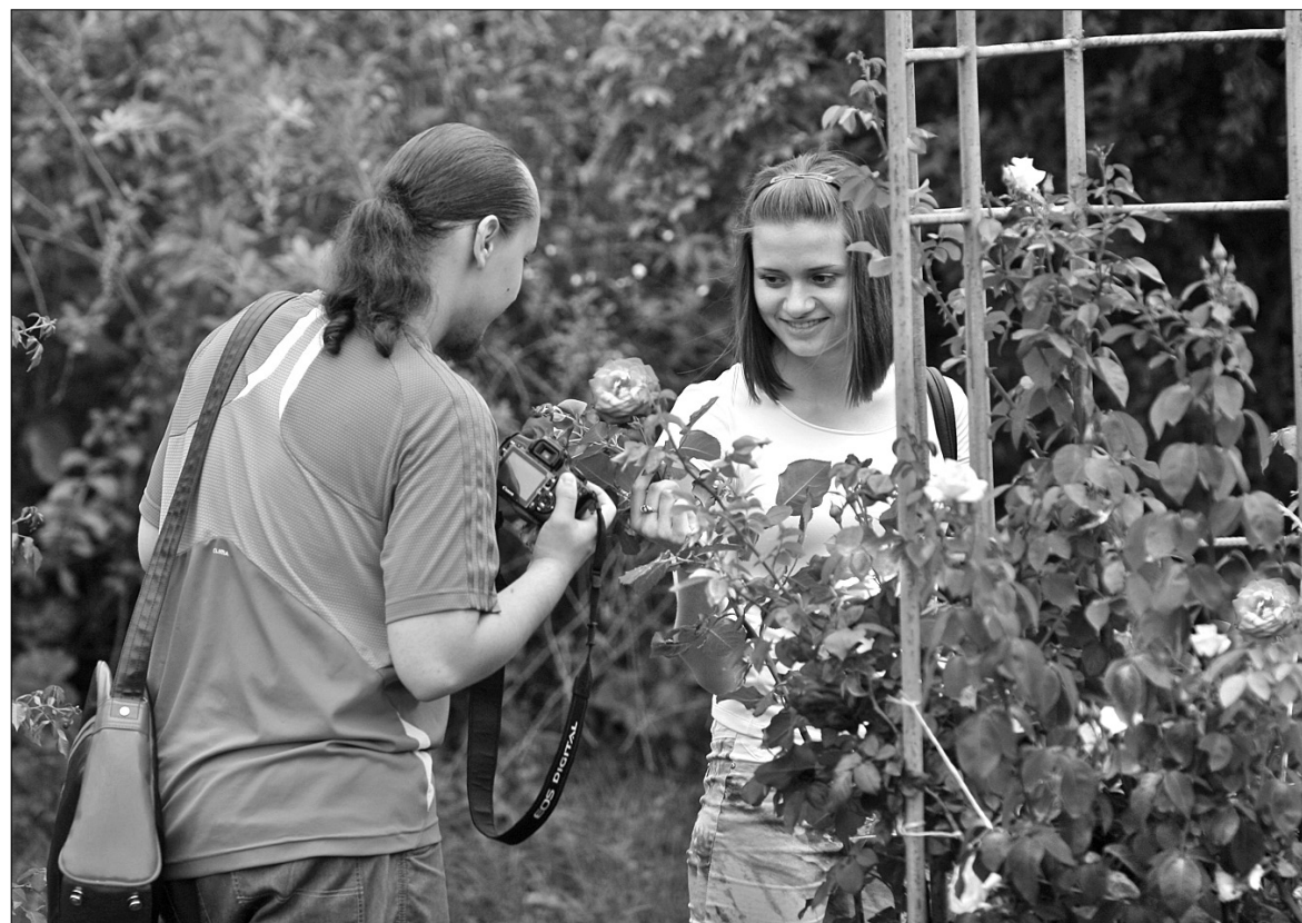
Кияни та гості міста можуть помилуватися розквіттям троянд у Ботанічному саду імені Миколи Гришка

Національний ботанічний сад імені Миколи Гришка було засновано в 1935 році, а розарій розпочав своє життя лише в рік закінчення Великої Вітчизняної війни. Саме тоді в ще зруйнованому Києві мешканці міста разом із академіком-селек-