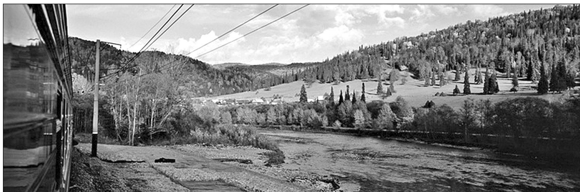
Віддалені куточки Росії неперевершені у своїй первозданній красі

Для всього світу Росія асоціюється переважно з Кремлем, Червоною площею, Москвою, в кращому випадку до переліку додається Ермітаж та Золоте Кільце. І нібито всі знають, що ця держава становить 1/6 суші Земної кулі, проте чітке уявлення про те, як ця частина суші виглядає, мають одиниці. Дослідник природи сусідньої держави та фотограф Антон Ланге відкрив таємницю російських околиць.