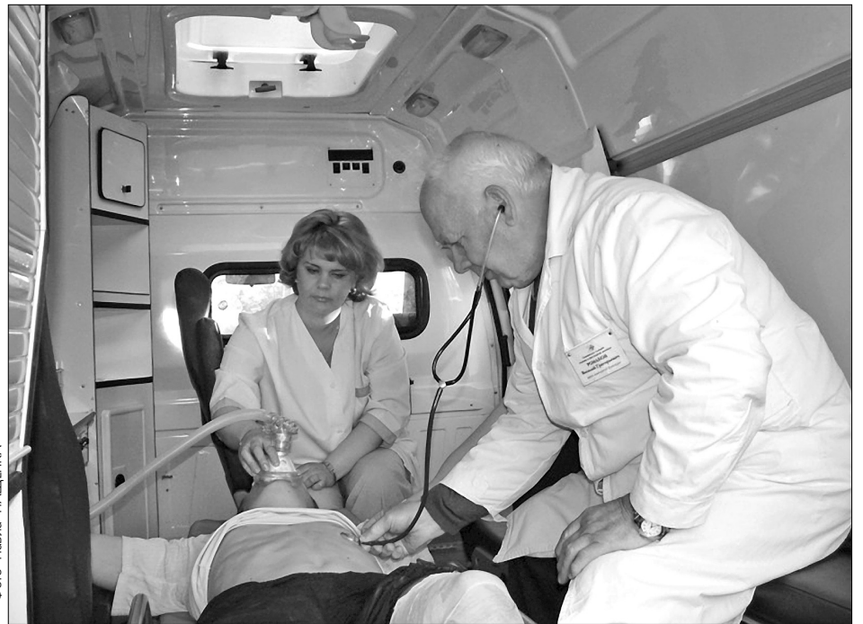
Відтепер екстрену медичну допомогу отримуватимуть ті, хто дійсно її потребує

Тож чекати екстреної медичної допомоги варто у випадках втрати свідомості, судом, раптового розладу дихання, раптового болю в ділянці серця, блювотинню кров'ю, гострого болю в животі, рясної кровотечі всіх видів, травмування, у випадках ДТП, ураженнях електричним струмом, блискавкою, при порушенні нормального перебігу вагітності та в інших надзвичай-