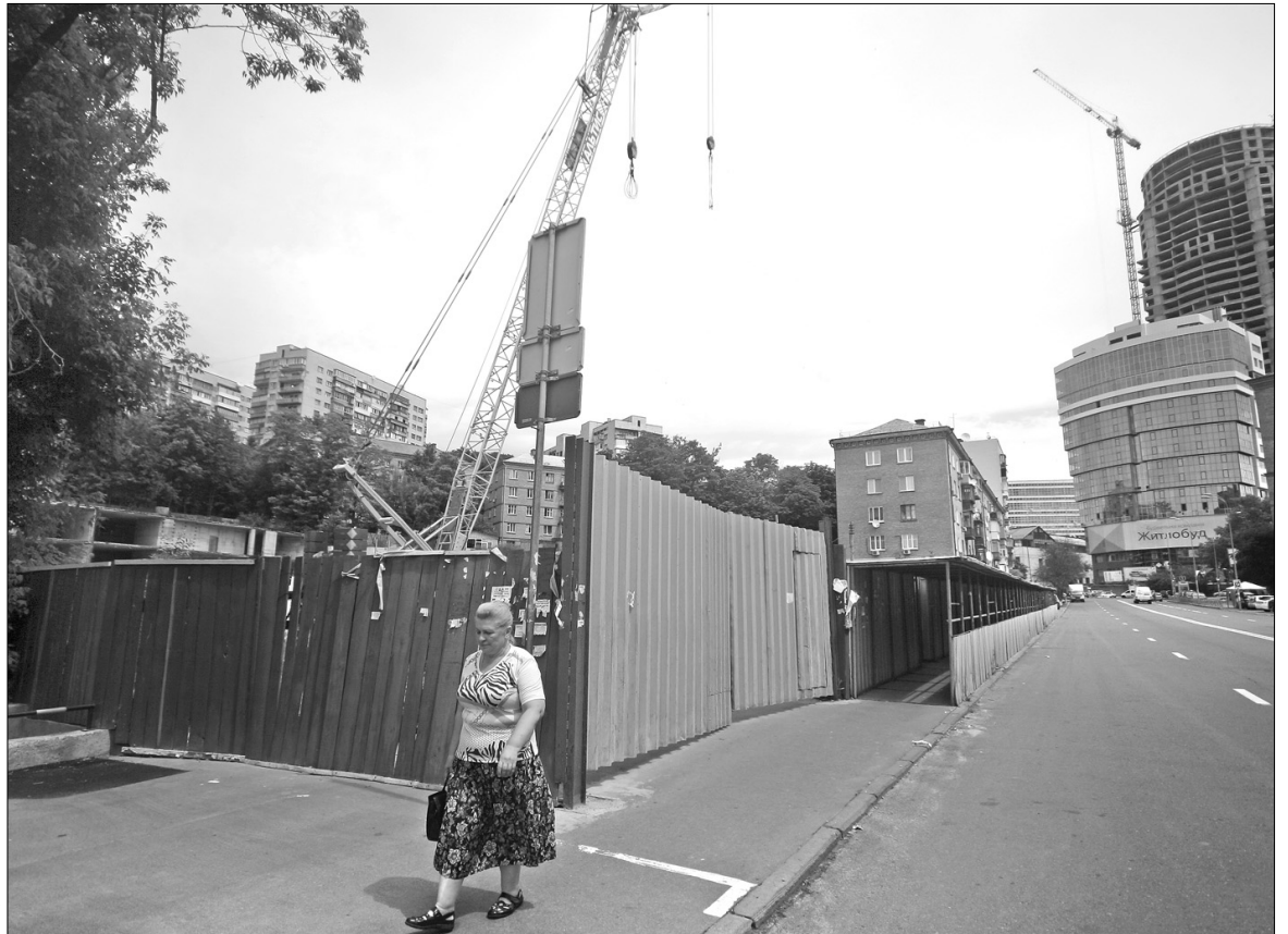
Проблеми конфліктних забудов вимагають втручання міської влади