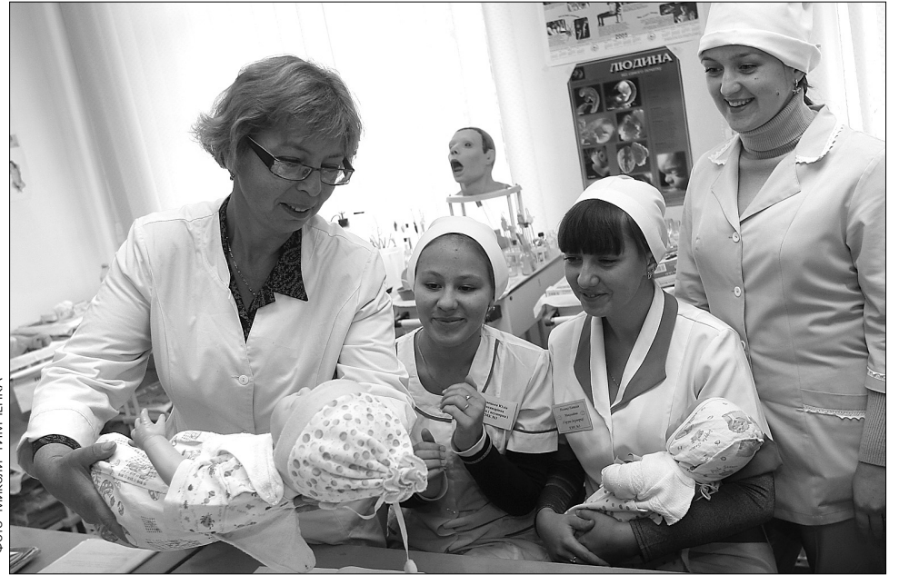
Люди в білих халатах супроводжують нас від народження до останніх хвилин

Аби медики могли працювати ще краще, міська влада в цьому році виділила на потреби галузі на 200 млн грн більше. Для працівників збережено надбавки до зарплати. Допомогли, як могли, адже від медиків залежить здоров'я та життя киян. Утім, окрім фінансової підтримки, у влади для винуватців свята знайшлися й добрі слова. "Шановні медики, прийміть найщиріші ві-