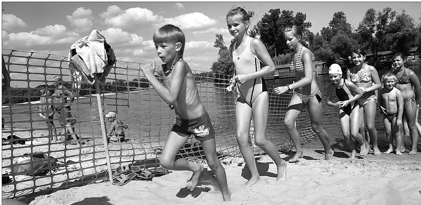
Здоров'я маленьких киян — головна турбота міської влади

Найталановитіших та дітей-сиріт відправляють до санаторіїв