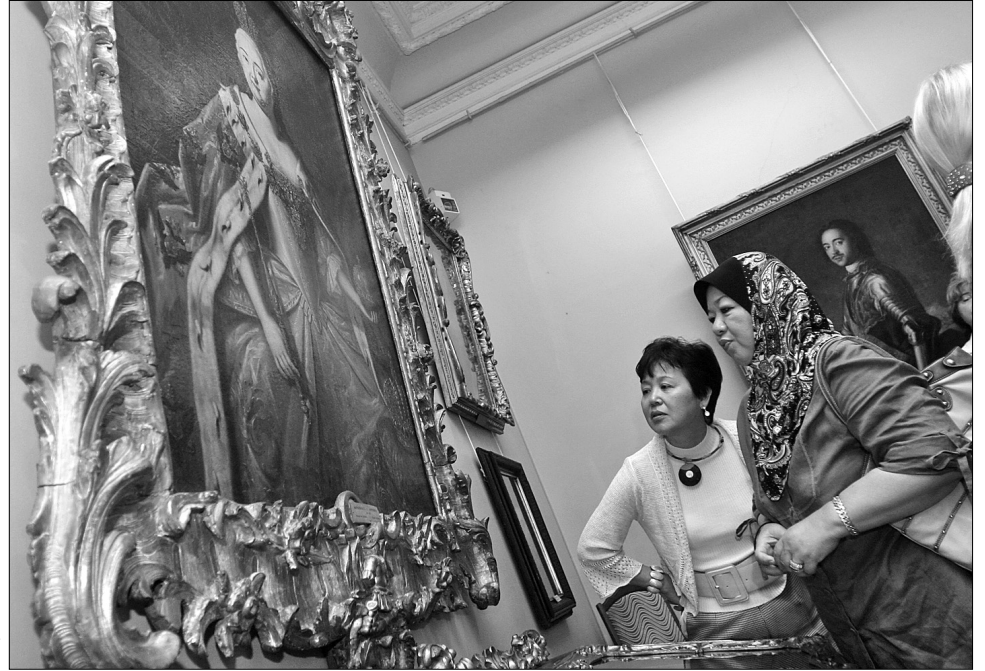
Під час візиту до Музею російського мистецтва дружини дипломатів подовгу роздивлялися полотна, ділилися враженнями

"Такі поїздки разом із Генеральною дирекцією з обслуговування іноземних представництв Київради ми влаштуємо і для послів іноземних держав, і для дипломатичного корпусу, — пояснює дружина заступника міністра закордонних справ