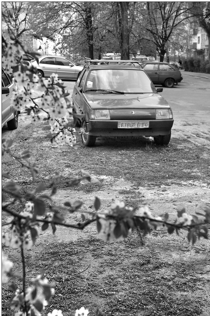
Автомобіль, який заїхав на зелену зону чотирима колесами, в середньому ушкоджує 7 кв. м газону

З метою виявлення порушників створено комісії, що постійно проводять рейди. За підрахунками зеленбудівців, автомобіль, який заїхав на зелену зону чотири колеса, в середньому ушкоджує 7 кв. м газону. Вартість відновлення пошкодженої площі газону, розрахованої відповідно до норм та розцінок, становить 454 грн. Штраф за знищення квітників становить від 17 до 51 грн. Штраф за наїзд на зеле-