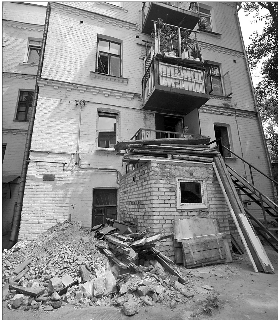
З настанням ремонтного сезону утилізація будівельного сміття стає неабиякою проблемою

Якщо і є договір з ЖЕКом щодо надання комунальних послуг, то самостійно вивозити сміття мешканці не зобов'язані, інформують фахівці Головного управління комунального господарства КМДА, це робота постачальника цих самих послуг. До слова, в цьому договорі вказують перелік робіт, які повинна виконувати експлуатаційна організація, зокрема там має бути й вивезення побутового і будівельного сміття. Інша річ, що бетон, кахель та інші важкі відходи не можна кидати у звичайні контейнери. Їх ліпше складати в мішки і виносити на сміттєвий майданчик. Якщо ж немає договору з ЖЕКом, то, можливо, і не вдасться переконати його начальника в тому, що утилізація будівельного сміття є обов'язком житлово-експлуатаційної організації. Тож доведеться за це заплатити. Зазвичай подача трактора з причепом коштує 50 гривень. Увесь непотріб потрібно зібрати в мішки і скласти в такому місці, де він не заважатиме сусідам та комунальним службам. Заборонено за-