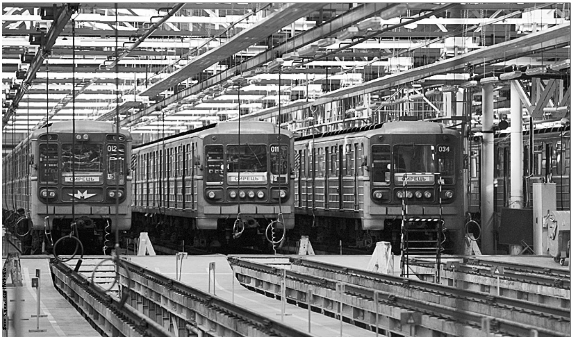
Київський метрополітен щоденно надає транспортні послуги майже 1,8 мільйона пасажиром

Уряд вніс Київський метрополітен до переліку тих, що не підлягають приватизації