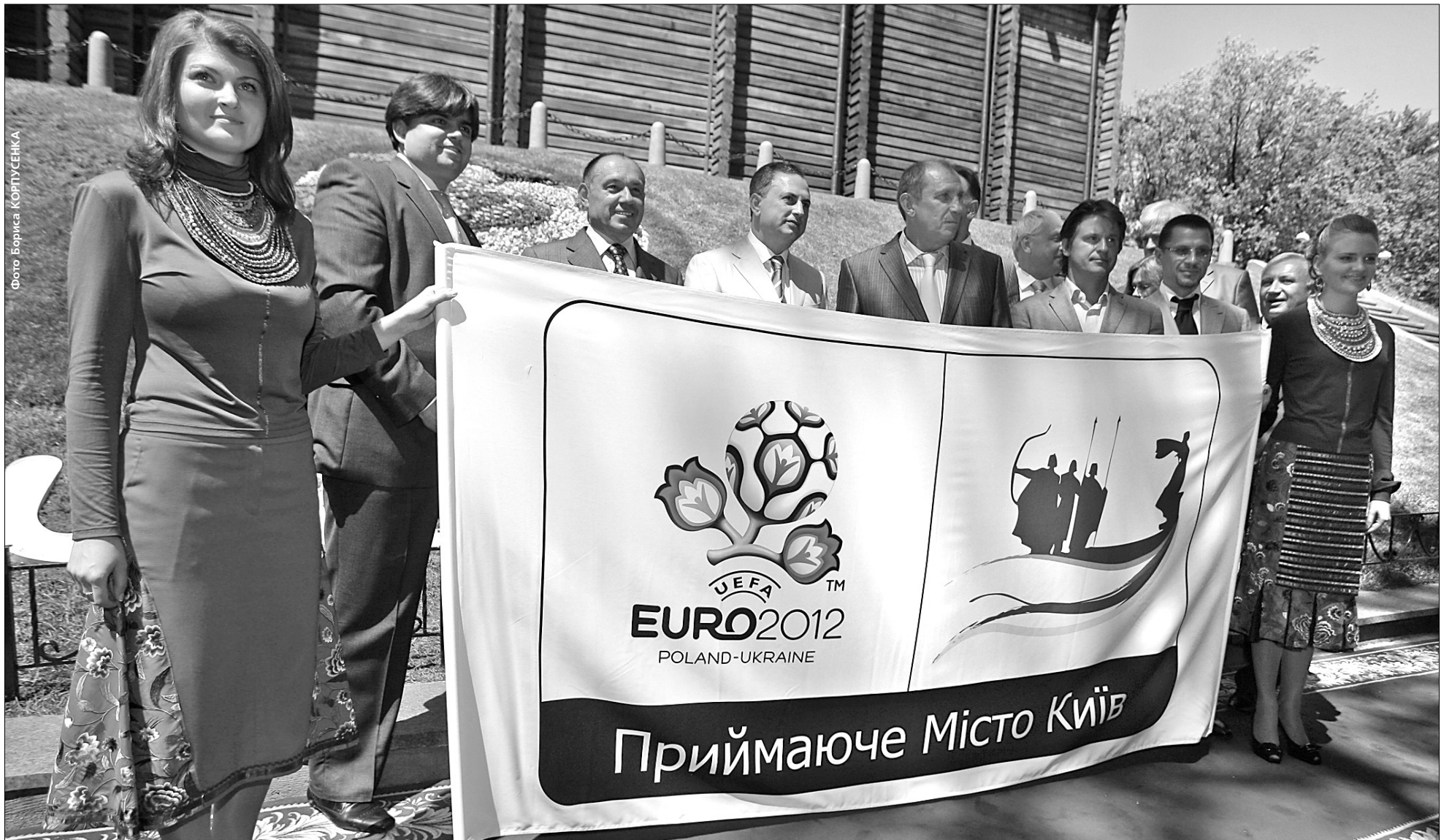
Столичний логотип Євро-2012 максимально відображає "футбольну душу" Києва

До початку чемпіонату Євро-2012 залишилося 2 роки