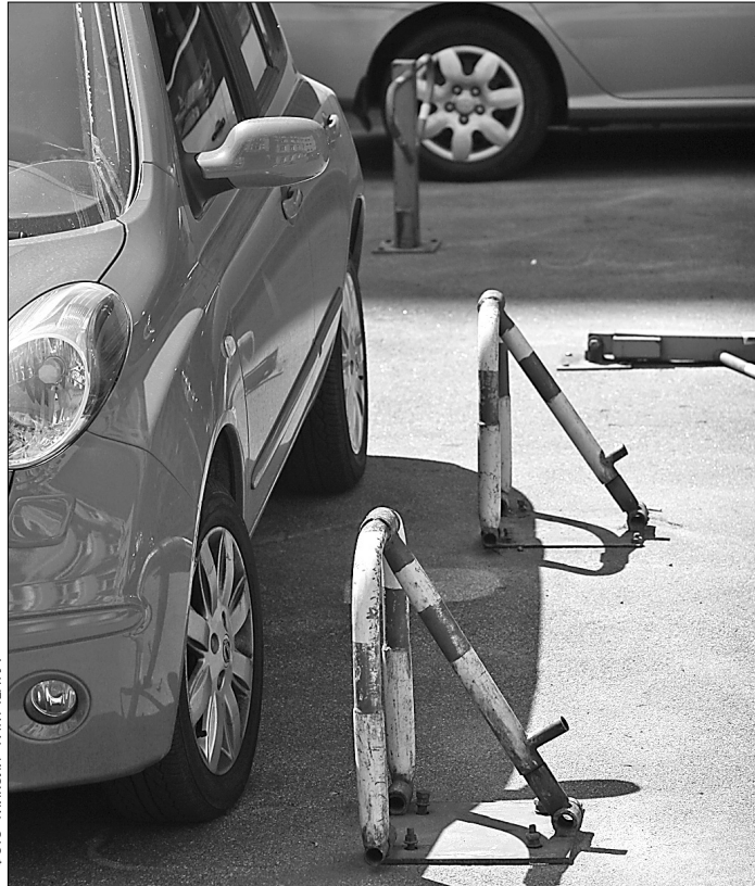
Через самовільно встановлені паркувальні блокіратори кияни не можуть дістатися власних дворів

"Мешканцям варто звернутися з заявами та скаргами до ЖЕКу, районного управління архітектури та міліції. Потрібно остаточно з'ясувати, чи брали дозволи на ці конструкції. Якщо ні — вимагати через суд їх знесення. На жаль, однозначно питання доступу до прибудинкової території в законодавстві не прописано. Тому деякі жителі цим користуються. Однак самовільно зносити не рекомендуємо. Це може розглядатися як пошкодження особистої власно-