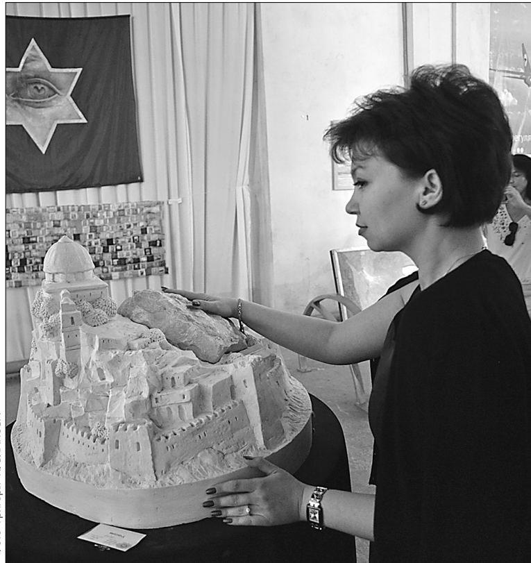
На Днях Ізраїлю в Україні до деяких історичних пам'яток можна було навіть доторкнутися руками

Дійство організували у "Мистецькому арсеналі". Там створили своєрідне ізраїльське містечко, як Тель-Авів. Відвідувачі могли залишити дітей на ігровому майданчику, а самі відвідати книжкові крамниці, купити прикраси, побувати в кінотеатрі та ознайомитися з діяльністю ізраїльських фірм у столиці. Представники культурних центрів знайомили відвідувачів із можливостями безплат-