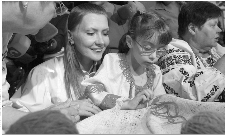
Виконувач обов'язків заступника голови КМДА Алла Шлапак упевнена, що вишиваний рушник стане символом єднання міста

Культурно-мистецька акція — вишивання рушника "Оберіг української столиці" — стартувала у Києві. Вона розпочалася за ініціативи Управління у справах жінок, інвалідів, ветеранів війни та праці КМДА, Київського міського центру роботи з жінками та Благодійного фонду "Український рушник". Вишивати пам'ятку почали в спеціалізованій загальноосвітній школі-інтернаті № 11 для дітей із вадами зору та поглибленим вивченням предметів художньо-естетичного циклу. Разом із вихованцями закладу перші стібки зробила і