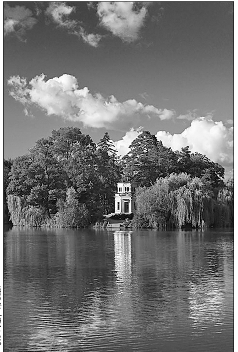
Рукотворний острів Любові з рожевим павільйоном і фонтаном “Змія”