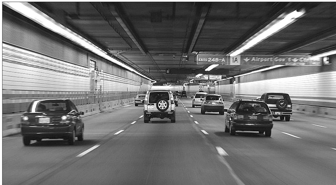
Автомобільні тунелі мають на меті зменшення заторів на магістралях та скорочення часу перебування в дорозі

У столиці можуть з'явитися п'ять автомобільних тунелів. Три з них проляжуть під Дніпром, а два стануть продовженням мостових переходів. Такі нововведення передбачено концепцією Генплану Києва. Підземні магістралі не тільки розвантажать центр міста, а й сприятимуть зменшенню заторів на дорогах. Фахівці стверджують, що вартість одного погонного метра тунелю в середньому становить від 50 до 100 тисяч євро.