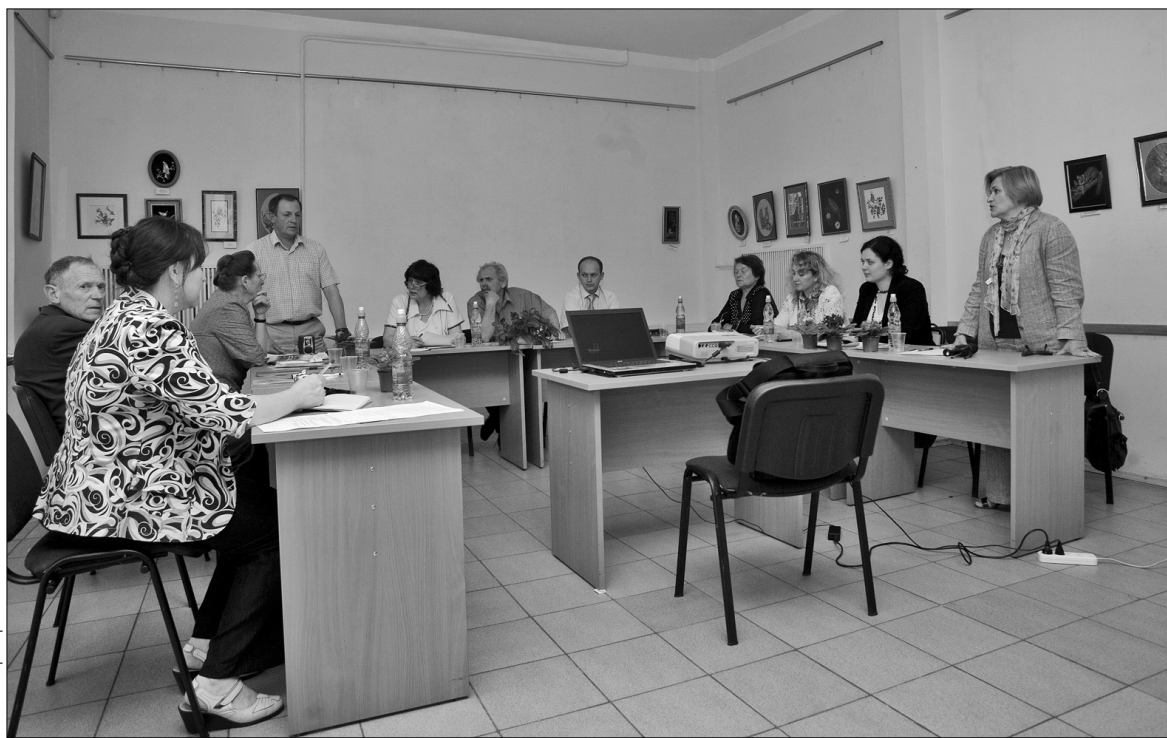
У рамках відзначення Європейського дня парків столичні фахівці обговорювали шляхи збереження та збільшення в місті зелених оаз