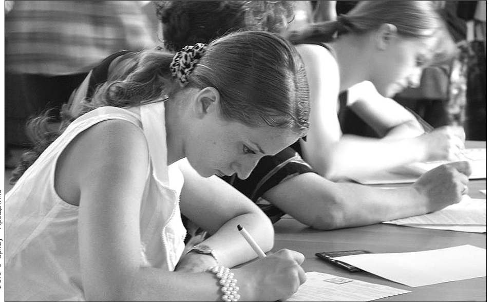
У понад 19 тисяч випускників столичних шкіл днями завершилися іспити з трьох предметів, передбачених державною підсумковою атестацією