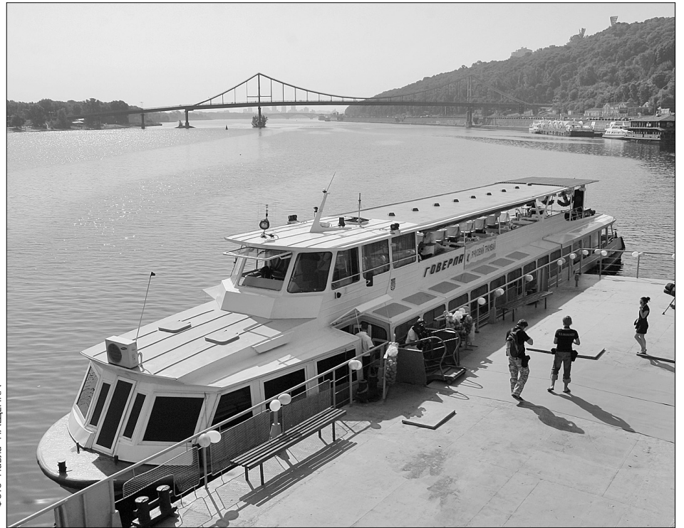
Річковий трамвай готується провезти столичних туристів оновленим маршрутом із додатковими зупинками

За словами перевізників, іноді з 200 місць на катері було зайнято лише 5. То-