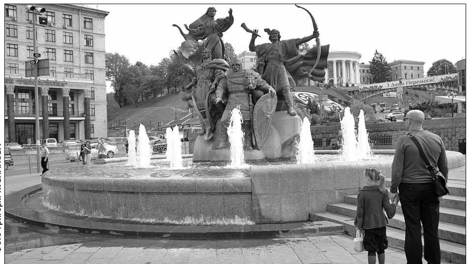
На травневі свята відремонтовані київські водограї радуватимуть гостей міста

Для того, щоб водограї вчасно запрацювали, КМДА виділила 607 тисяч гривень