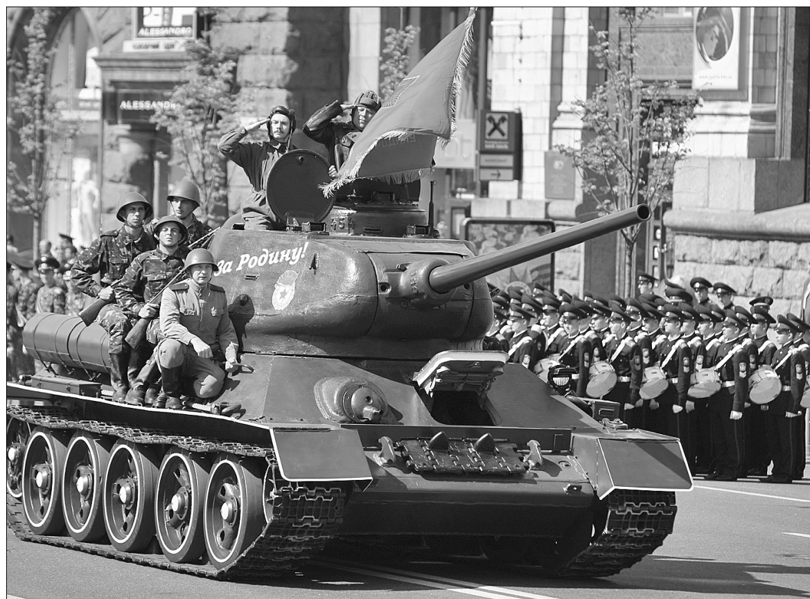
Крім історичної техніки, у параді Перемоги візьмуть участь російські та білоруські військовослужбовці