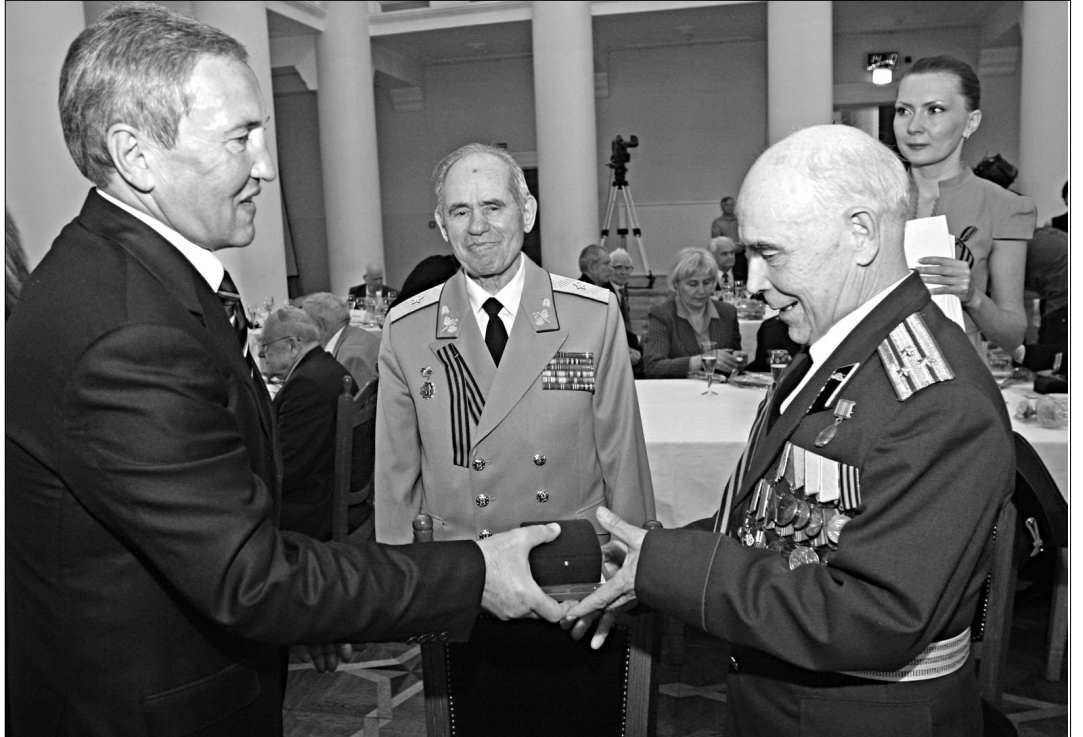
Мер Леонід Черновецький пообіцяв, що міська влада зробить усе для гідного життя ветеранів столиці

Загалом Леонід Черновецький разом із виконувачем обов'язків заступника голови КМДА Аллою Шлапак особис-