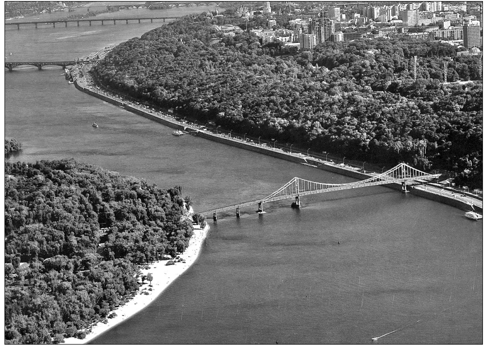
За 15 років у Києві побудують щонайменше два мости та розіють 18 буферних зелених зон

Концепція розвитку транспортної мережі має на меті завершення будівництва Великої міської кільцевої дороги, ліній мет-