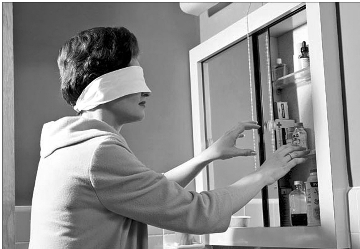
Обираючи ліки за підказкою телевізора, можна зробити велику помилку

"Вам потрібен "Мезим" — звучить у ваших вухах. "От молодець!" — не говорить, а кричить на екрані чоловік жінці, що несе до столу гори закусок, бутиль самогону. А вона: "Іжте, ось варенички ще!" А чи знаєте ви, що "Мезим" і помічник, і ворог шлунку? Він справді справляєть-