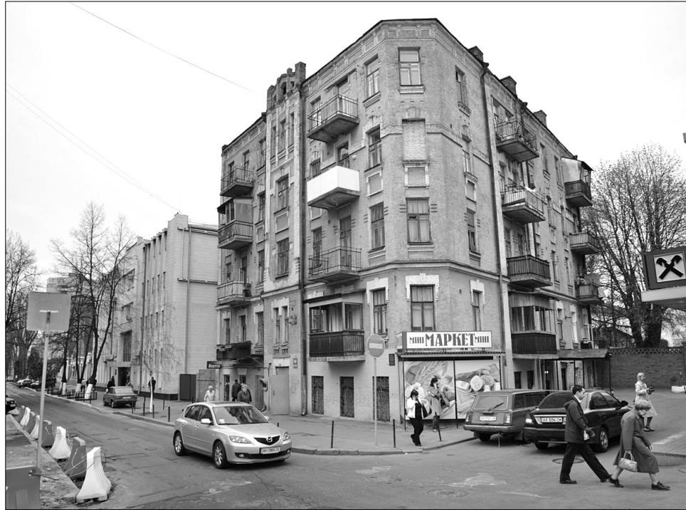
Сторічний будинок у центрі столиці чекає на увагу з боку влади

З кожним роком будинок просідає. Стіни вражені грибок до третього поверху.