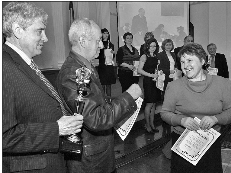
Героїв третьої профспілкової спартакіади КМДА і Київради нагороджували дипломами, кубками та грошовими заохоченнями

У Третій спартакіаді об'єднання первинних профспілкових організацій КМДА та Київради "Праця і спорт ведуть до висот" взяли участь майже тисяча учасників із 39 організацій. Протягом трьох місяців розігрувалися нагороди в п'яти видах спорту. Перше загальнокомандне місце виборола команда Центру соціальних служб сім'ї, дітей та молоді Дніпровського району.