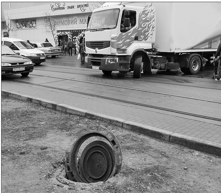
Відкриті люки несуть величезну загрозу життям киян

У мерії переймаються не тільки фінансовими втратами, а й тим, що такі витівки крадіг становлять значну загрозу здоров'ю та життю киян. Протягом січня-лютого в каналізаційні ями провалилися шестеро осіб. Вони отримали опіки різних ступенів і травми ●