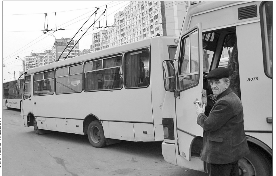
Поїздка на роботу для киян є справжнім випробуванням — водії приватних маршруток перевозять людей у зламаних авто і постійно порушують правила

Перевірити якість надання послуг маршрутниками взялася київська ДАІ. Вона провела операцію "Автоперевізник". За два тижні з маршрутів через поганий технічний стан зняли 900 автобусів. "Ще 96 перевізників не мали ліцензії, а 11 узагалі