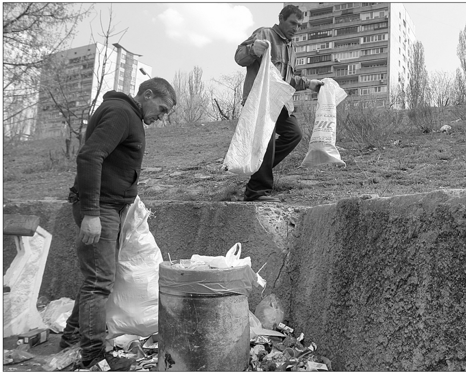
Допомагаючи місту безпритульні заробляють за день 30—50 гривень

Зони відпочинку біля води прибиратимуть від сміття, що піддається вторинній переробці (скла та пластику), з 8 до 15 квітня. "Лише протягом перших трьох днів співпраці "Плеса" та фонду "Соціальне партнерство" було вивезено двісті сорок п'ять 50-літрових мішків сміття. За кожний з них