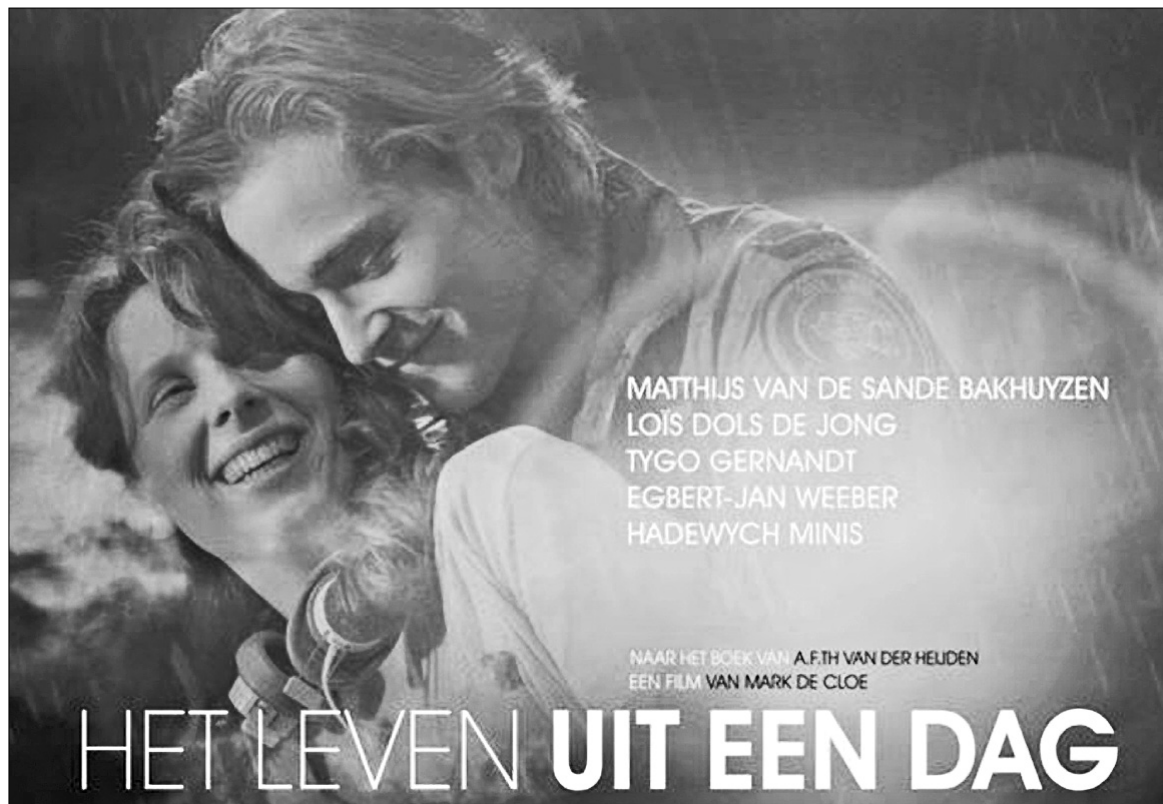
Хедлайнер фестивалю — "Життя в один день" режисера Марка де Клоє

Ще один хедлайнер фестивалю — "Життя в один день" режисера Марка де Клоє, котрий стане гостем відкриття. Дія цього фільму розгортається на дивному світі, де життя триває лише один день, — принаймні в цьому переконані його мешканці, — а кожен учинок можна здійснити лише раз. Головні герої фільму — двоє закоханих, які не хочуть миритися з цим правилом і роблять усе, щоб продовжити спільне існування. У фільмі "Атлантида" Дігни Сінке також представлено вигаданий світ, який нагадує похмуру антиутопію. Головна героїня, тринадцятирічна дівчинка,