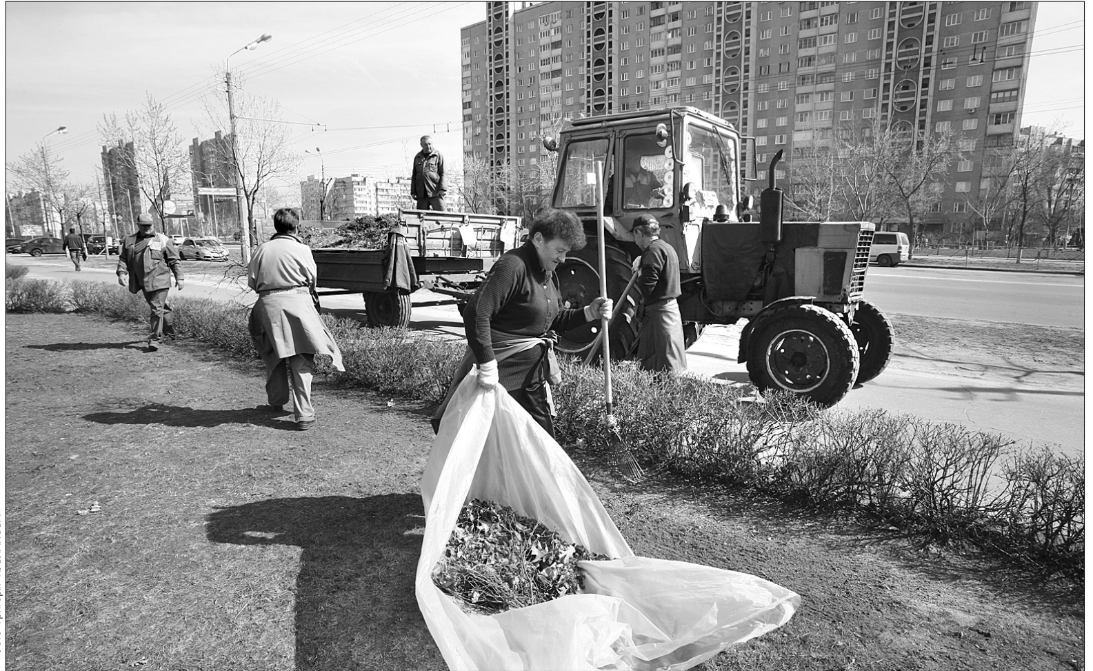
Районні комунальники поставилися до розпорядження мера з усією серйозністю

Крім того, в рамках програми прибирання до 29 березня в районі прибрали сніг від піскомету, позрізали старі дерева, поставили нові контейнери для відходів. Деснянці активно готуються до озеленення, висадження квітів, дизайнерського оформлення деяких прибудинкових територій. Уже відновлено зовнішнє освітлення біля входу майже сотні будинків.