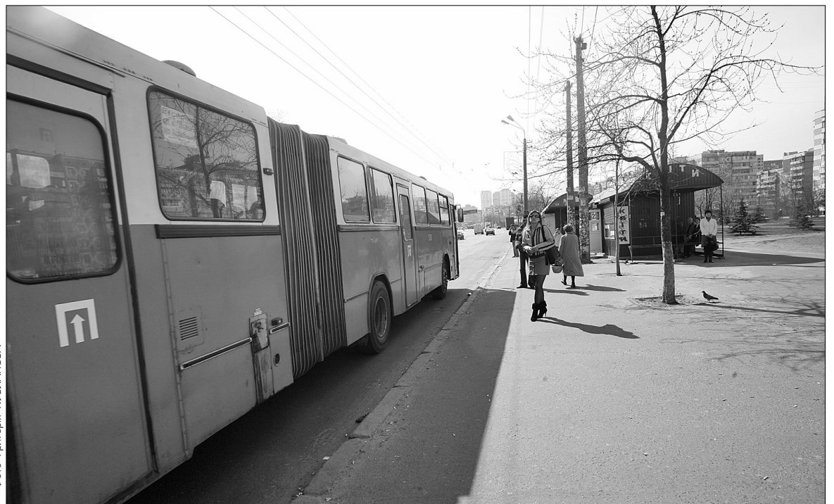
Побачити сміття у громадських місцях кореспондентам "Хрещатика" так і не вдалося

Приємно, що слова районних чиновників не розходяться з ділом. Журналісти "Хрещатика" пройшлися вулицями та подвір'ями, завітали до місцевих скверів. Всюди видно результати роботи комунальників. І хоча подекуди сміття ще є, активність людей з мітлами в руках обнадіює: Деснянський район впорядується із завданням, яке поставив міський голова Леонід Черновецький, та гідно підготується до свята ●