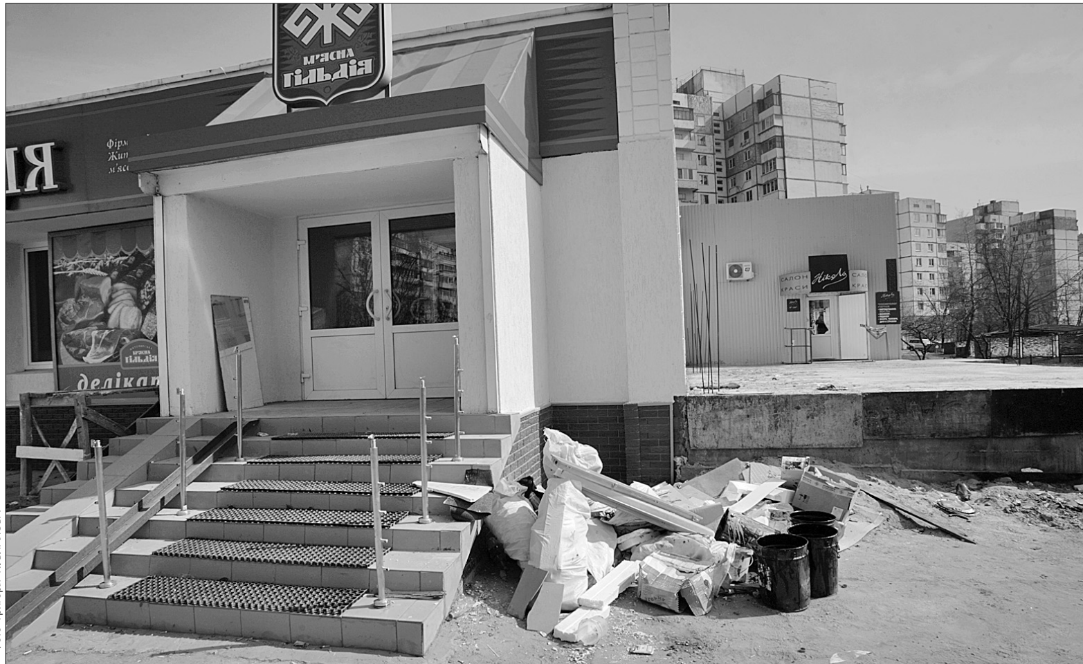
Вулиця Героїв Сталінграда. Неприбране будівельне сміття

Спільними зусиллями влади, комунальників і жителів району під час суботника минулими вихідними очистили зелені зони вздовж вулиць Прирічної, Майорова, Кондратюка та Оболонського проспекту. Вивезли 52 кубометри усякого сміття з 28 гектарів. Того ж дня шляховики прибирали від бруду понад сімдесят кілометрів доріг. Попрацювали комунальники і для маленьких оболонців. Під час толоки частково поремонтували та очистили дитячі майданчики за адресами: вул. Лайоша Гавро, 5, 7, 9-в та пр-т Оболонський, 16, 18. Також прибрали сміття зі спортивних майданчиків на вулицях Маршала Тимошенка, Зої Гайдай і Богатирській. Відремонтували і тридцять вісім лав для відпочинку.