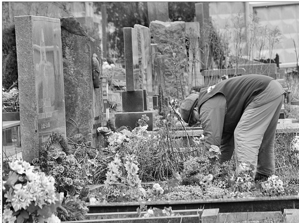
Цього року поминальні дні триватимуть з 11 квітня до 9 травня