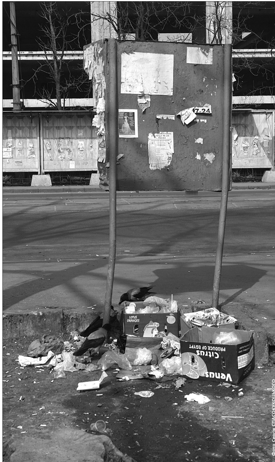
Поблизу Дарницького вокзалу

"Така гарна погода, чому б не попрацювати на свіжому повітрі? Тим паче, що наведення чистоти — це ж свята