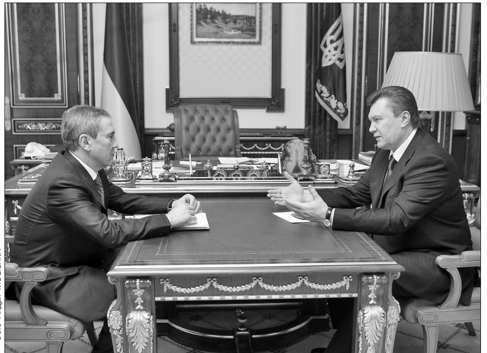
Мер Леонід Черновецький конструктивно обговорив із Президентом Віктором Януковичем розв'язання проблем столиці

Леонід Черновецький, так і більшість його заступників, тривала приблизно дві з половиною години. Обговорювали ситуацію у сфері надання житлово-комунальних послуг, питання освітлення вулиць, ремонту доріг, вивезення сміття. «Засідання проходило у звичайному режимі — звіти, протоколи, вказівки. Ми обговорили плани роботи, будемо працювати далі», — прокоментував зустріч перший заступник голови КМДА Анатолій Голубченко. Прем'єр-міністр Микола Азаров пообіцяв широку підтримку Києву, при цьому його обурило поведінка окремих керівників районів, які працюють неефективно і не хочуть співпрацювати з владою міста. «Столиця мусить продемонструвати для інших міст України, що навіть за умов кризи та обмеженого бюджетного фінансування можна забезпечити гідні умови проживання громадянам», — зазначив глава уряду.