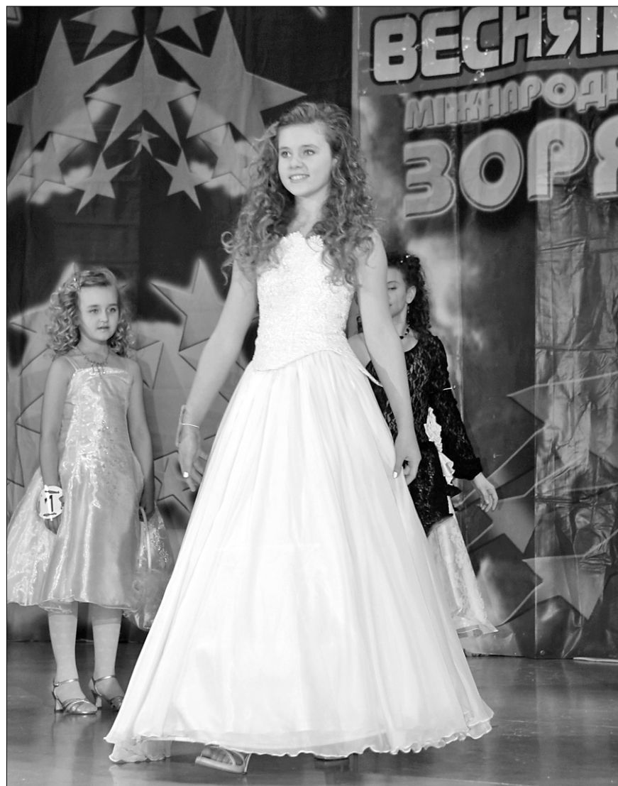
У рамках фестивалю відбувся і конкурс красунь “Міс Весняний зорепад 2010”

Також у рамках фестивалю відбувся і конкурс красунь “Міс Весняний зорепад 2010”, який відкрив чарівний світ дівочої вроди. Дівчатка не лише демонстрували одяг, а й мали показати вміння втілювати образи, з’явившись перед публікою в українському вбранні, авангардних костюмах, з іграшкою та у бальних сукнях ●