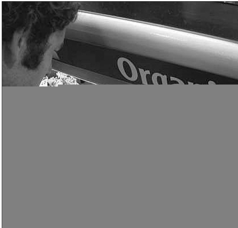
На Заході органічні продукти мають спеціальне позначення

Загалом в Україні органічна продукція становить лише 5—10 % сільськогосподарської продукції, і