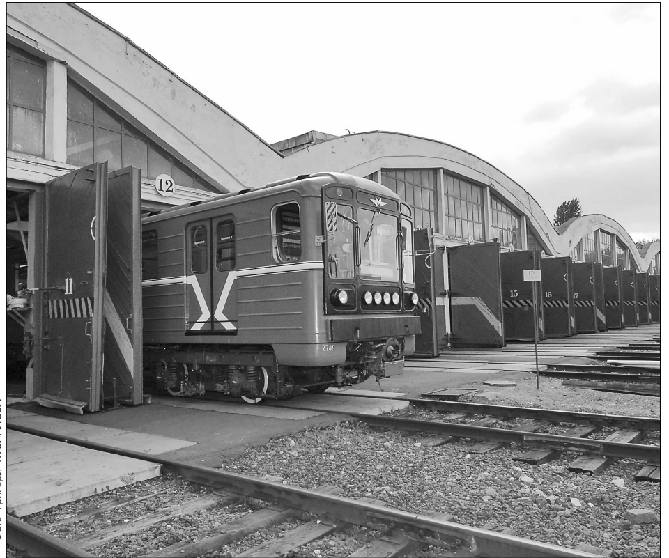
Будівництво нової лінії столичного метро на Троєщину, попри кризу, зрушило з місця