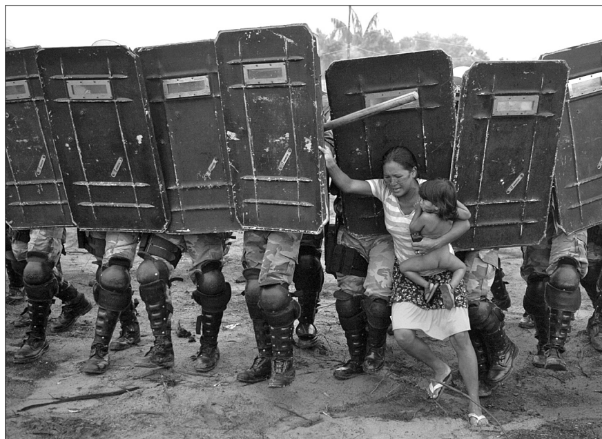
Жінка намагається зупинити насильницьке переселення її народу, Манаус, Бразилія, 10 березня, 2008

Сучасні медіа неможливо уявити без ефектних фоторепортажів, які переносять обивателя в “найгарячіші” точки світу. Питання про те, наскільки “реальним” є таке перенесення — залишається відкритим, адже саме завдяки новітнім технологічним ефектам і якісній подачі інформації перед медіа відкриваються колосальні можливості для маніпуляції громадською думкою. Що може бути переконливішим за моторошне фото пораненої дитини або мертвого солдата на полі бою? Це, так би мовити, “вбивчий аргумент”, яким активно користуються всі провідні світові ЗМІ, підтримуючи інформаційну політику своїх політичних патронів і за-