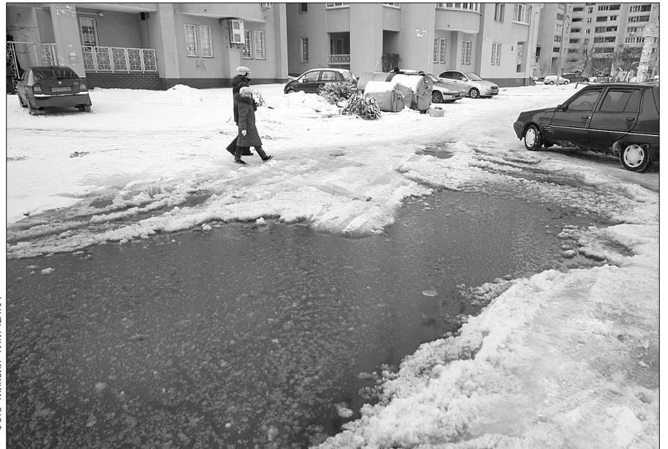
На багатьох вулицях уже нині ні пройти, ні проїхати

"За результатами перевірки встановлено, що водоймища захищені побутовим сміттям, поваленими деревами, очеретом та чагарником, замулені, внаслідок чого пропускна спроможність проходження во-