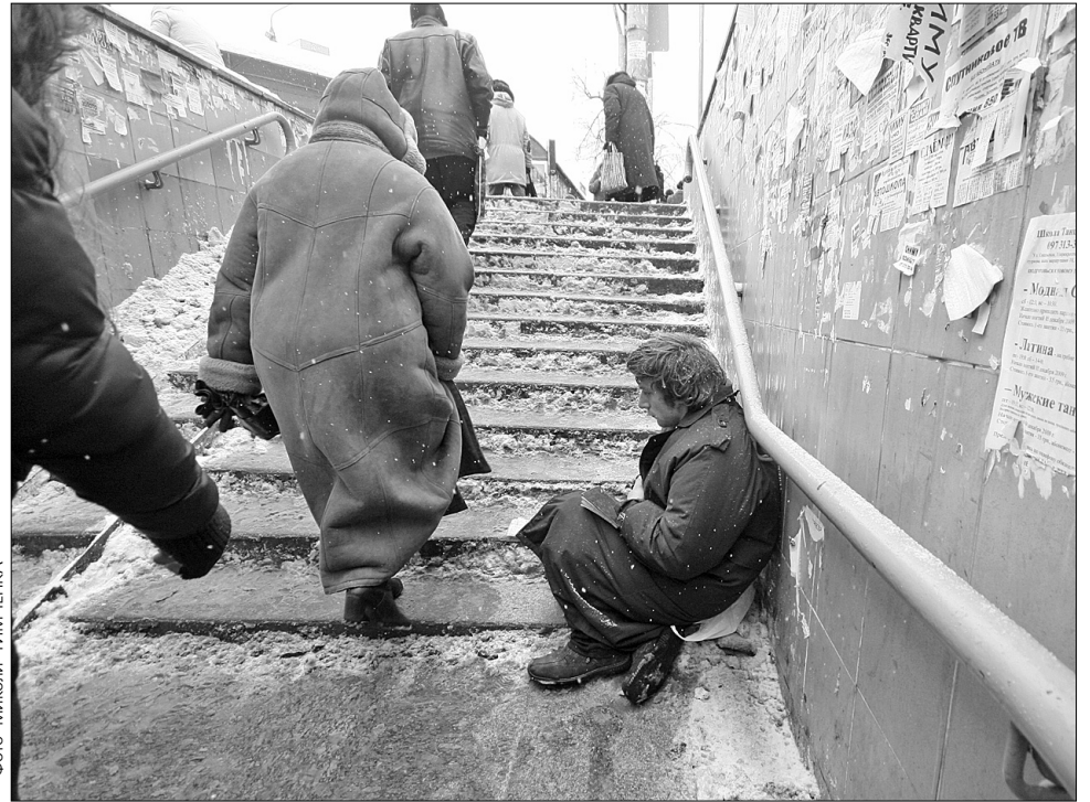
Районні власті мають зробити все можливе, аби прибрати безпритульних з вулиці

Аби життя цих людей не залежало від банальних перепадів температури надворі, міська влада вже не перший рік організує заходи посиленої допомоги. Зокрема на вул. Суздальській, 4/6 працює Будинок соціального піклування. Там можна не лише погрітися, а й заночувати, облаштовано 166 ліжок. У кожному районі діють спеціальні соціальні центри, де безпритульним теж можуть допомогти. Холодної пори року в місті патрулюють три бригади, які розвозять безхатченкам гарячу їжу, найпростіші ліки, теплий одяг. З початку похолодання здійснили більш як 170 рейдів у місця скупчення безпритульних. Чимало хто з них рятує себе сам: оселяється в покинутих приміщеннях, підвалах, поблизу каналізаційних систем та гріється алкоголем. «Нині в нас ночують по 118–120 осіб, тобто вільні місця ще є, але безпритульні не йдуть до нас, бо їм