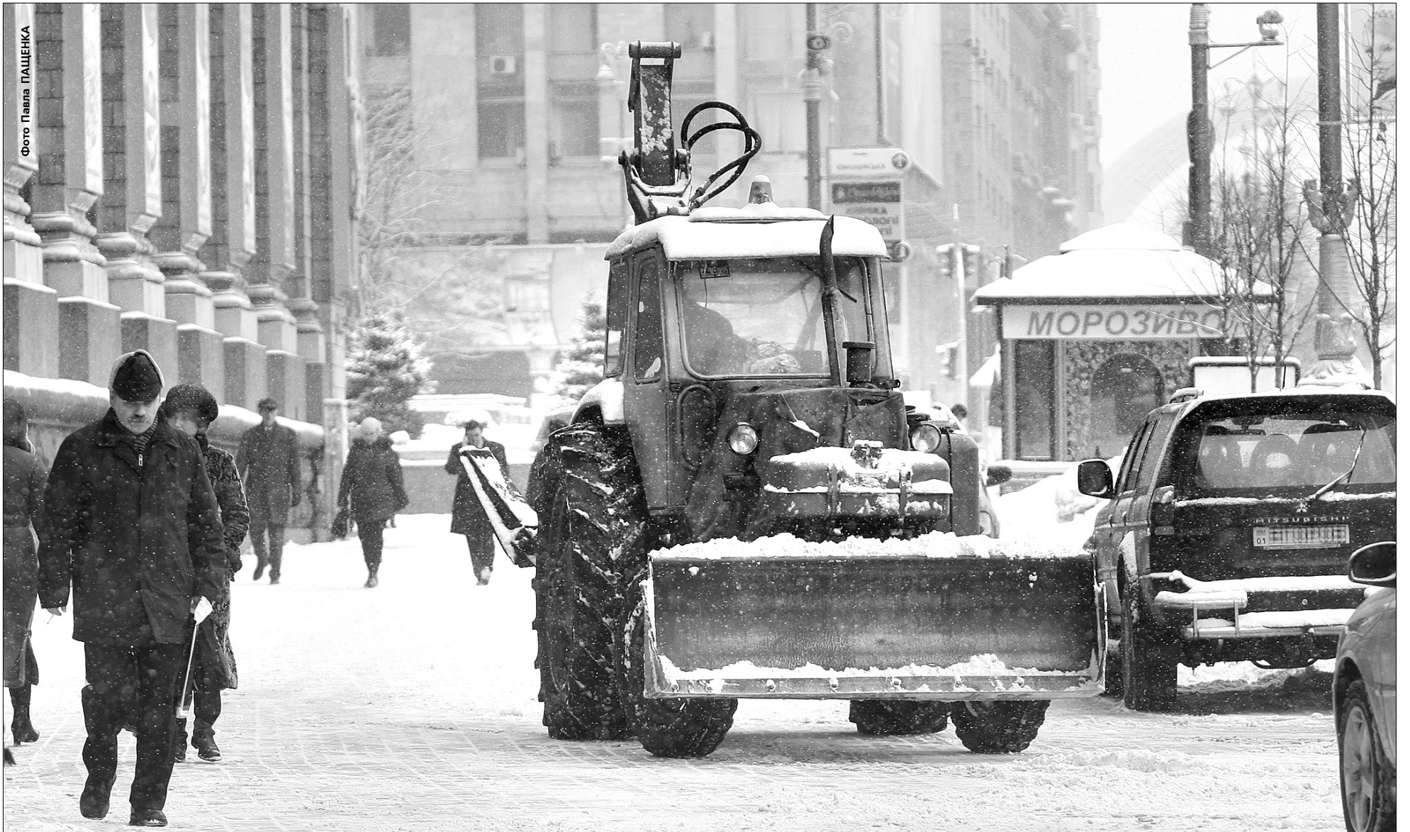
Київська влада на прибирання міста від снігопадів виділила 16,3 мільйона гривень

Більшість міст України не мають достатньо коштів на боротьбу з непогодою