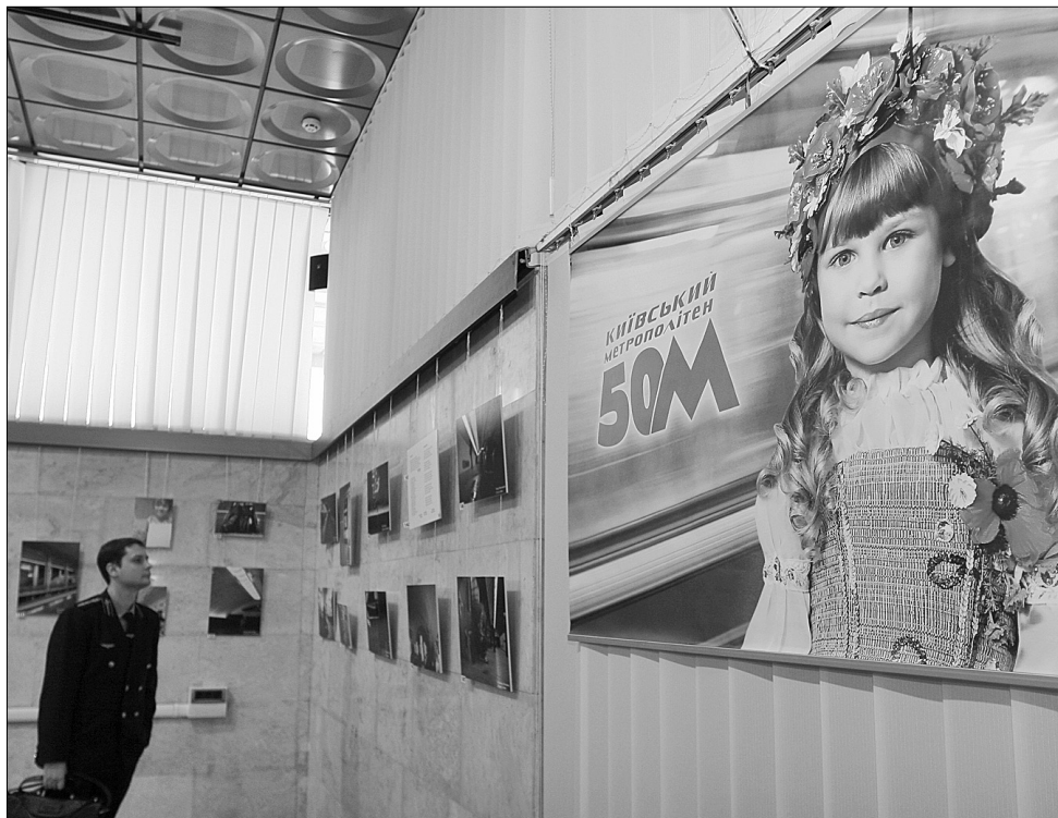
До 50-річного ювілею столичний метрополітен нагороджуватиме своїх прихильників майже рік

Усі охочі мали нагоду представити свої твори в тій чи іншій номінації. З поданих робіт сформували експозицію в Україн-