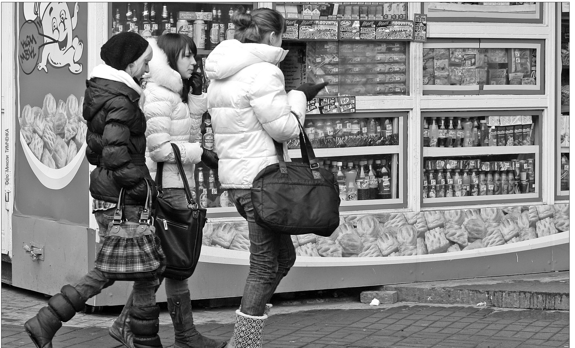
Кіоски зі спиртним невдовзі не спокушатимуть столичних підлітків-школярів біля навчальних закладів

Столична влада закриватиме кіоски зі спиртним біля шкіл