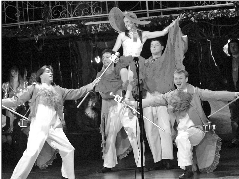
Театр юного глядача на Липках на честь 85-річчя влаштував святковий вечір

Минулого тижня один із найстаріших київських театрів — Театр юного глядача на Липках — відсвяткував 85-річчя. На день народження ювіляру подарували почесні відзнаки, картини і годинники, пісні та фрагменти вистав. Та найголовніше — спектаклі театру люблять маленькі глядачі та цінують дорослі, для яких також ставлять класичні твори.