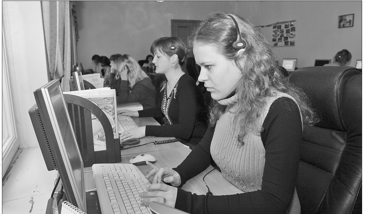
Навіть у свята кияни в будь-якій ситуації можуть сподіватися на допомогу call-центру

Близько 17 тис. звернень стосувалися надання медичної допомоги. Люди цікавилися пита-