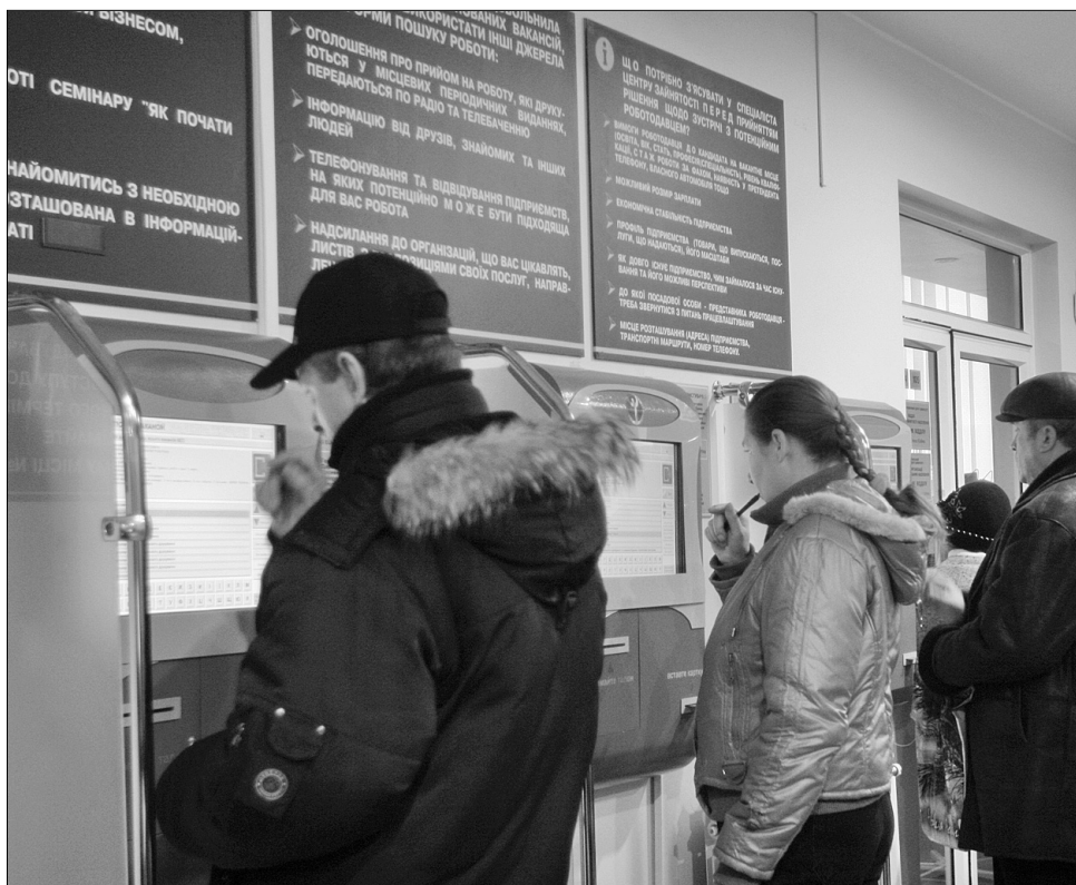
Для працедавців та шукачів роботи у Міській службі зайнятості працюють спеціальні інформаційні сервери

Якщо не вдалося знайти потрібну вакансію одразу, людям пропонували взяти участь в оплачуваних громадських роботах. Але прибирати парки, виконувати соці-