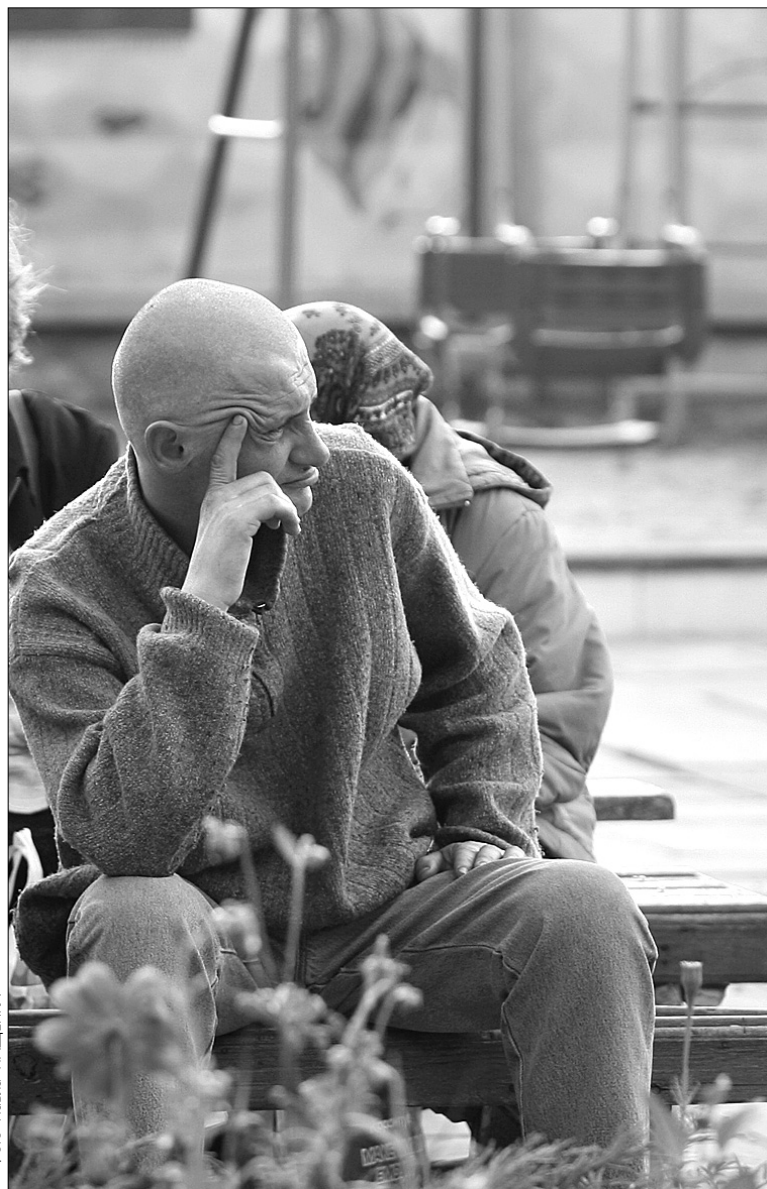
Фонд завжди готовий надати допомогу тим, хто її потребує

Сьогодні двері цієї благодійної організації відчинено як для жертв наркобізнесу, так і для охочих їм допомогти. Враховуючи, що благодійний Фонд має в своєму розпорядженні незначні засоби, за рахунок яких утримує два реабілітаційних центри, навіть незначна допомога кожного свідомого киянина зможе кардинально змінити