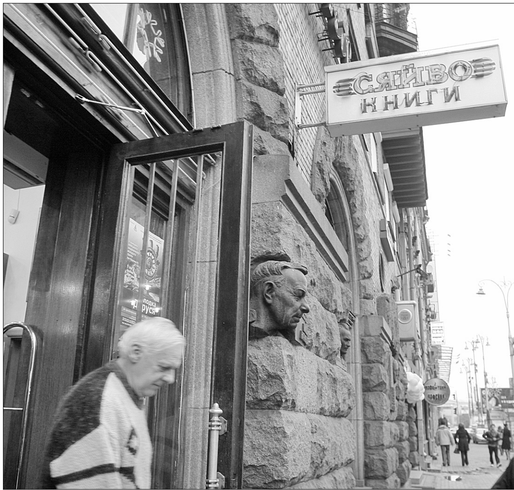
Працівники книжкового магазину "Сяйво" залишають своє приміщення поки що не збираються

Днями орендоване приміщення, в якому досі працював магазин, отримало нового власника, тож, як кажуть працівники книгарні, вже з січня вони можуть опинитися на вулиці. Нам пояснили, що приміщення продано ще у вересні, хоча робітники дізнались про це лише місяць тому. За словами голови постійної комісії Київради з питань культури й туризму Олександра Бригинця, питання про продаж з аукціону приміщення "Сяйва" через міськраду не проходило. Це ганебне рішення було ухвалено Шевченківською райрадою, якій і належала будівля. Причина — зацікавленість можновладців у нерухомості, яка знаходиться в самісінькому центрі міста. За словами пана Бригинця, такі ситуації з закладами культури виникають повсюдно, хоча Верховною Радою накладено відповідний мораторій на виселення редакцій друкованих засобів масової інформації, закладів культу-