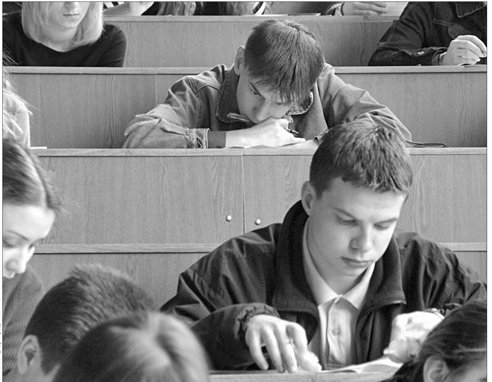
Можна гризти "граніт науки", а можна — заплатити