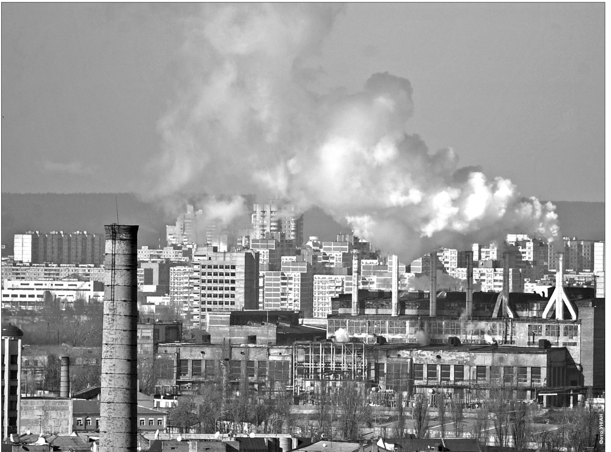
Дарницька ТЕЦ, яка використовує недоброякісний мазут, є одним з найбільших забруднювачів повітря у місті

Столичну атмосферу забруднюють 446 підприємств