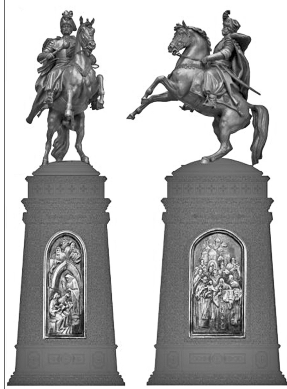
Пам'ятник гетьману Мазепі обійдеться столиці в 9,5 мільйона гривень

"За задумом авторів скульптурну композицію