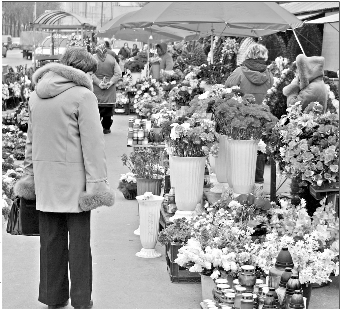
Поховання у столиці — справа непростя