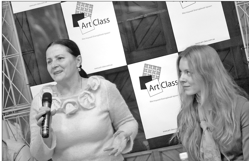
Народна артистка України Ніна Матвієнко з нетерпінням очікує на свій майстер-клас, щоб поділитися досвідом з київської публікою

Ще за радянських часів була традиція так званих творчих зустрічей, коли люди могли не просто побачити своїх улюбленців на концертах чи на виставках, а й поговорити в затишній обстановці, запитати в них про те, що найбільше цікавило. Добру традицію вирішив відродити міжнародний благодійний фонд "Моя Україна", що став ініціатором проекту Art-Class. У його рамках заплановано майстер-класи з відомими людьми, акустичні концерти співаків, виставки молодих та пер-