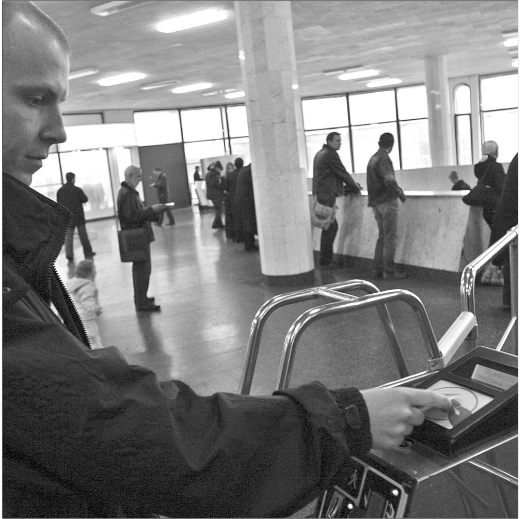
Річний проїзний на метро зекономить чимало часу

Незабаром у столичному метрополітені почнуть продавати єдині річні проїзні. Користуватися ними пасажири зможуть з 1 січня до 31 грудня. Коштуватиме квиток 910 грн. Окрім цього, в підземці поки що залишаються квартальні та місячні абонементи відповідно по 260 грн та 95 грн. Студенти традиційно матимуть у підземці знижки, а школярі користуватимуться підземкою безплатно. Водночас у "Київпастрансі" наразі вирішують, чи запроваджувати в столиці загальний річний проїзний на всі види транспорту — метро, трамвай, автобус, тролейбус, чи робити окремі лише для наземного. Розглядають варіант переходу лише на місячні абонементи.