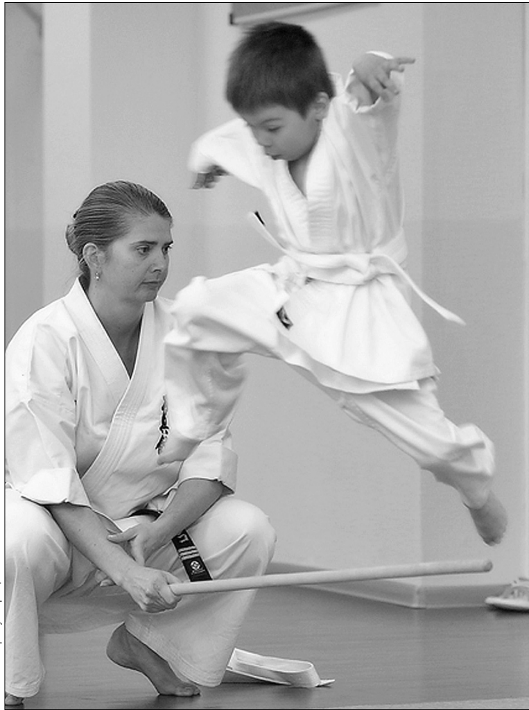
До секції бойових мистецтв маленьких киян приймають із шестирічного віку

"Хрещатик" уже писав про ініціативу олімпійських чемпіонів Яни Ключкової та Дениса Силантьєва, які заходилися вчити плавати усіх українських дітей. Почали з Києва та власне Голосіївського району. Нині басейни для дітей відкривають під час будівництва та навіть реконструкції шкіл. Але якщо ви хочете, щоб ваша дитина почувалася у воді як риба, можете відправити її до гуртків десяти столичних басейнів. Щоправда, не скрізь це безплатно.