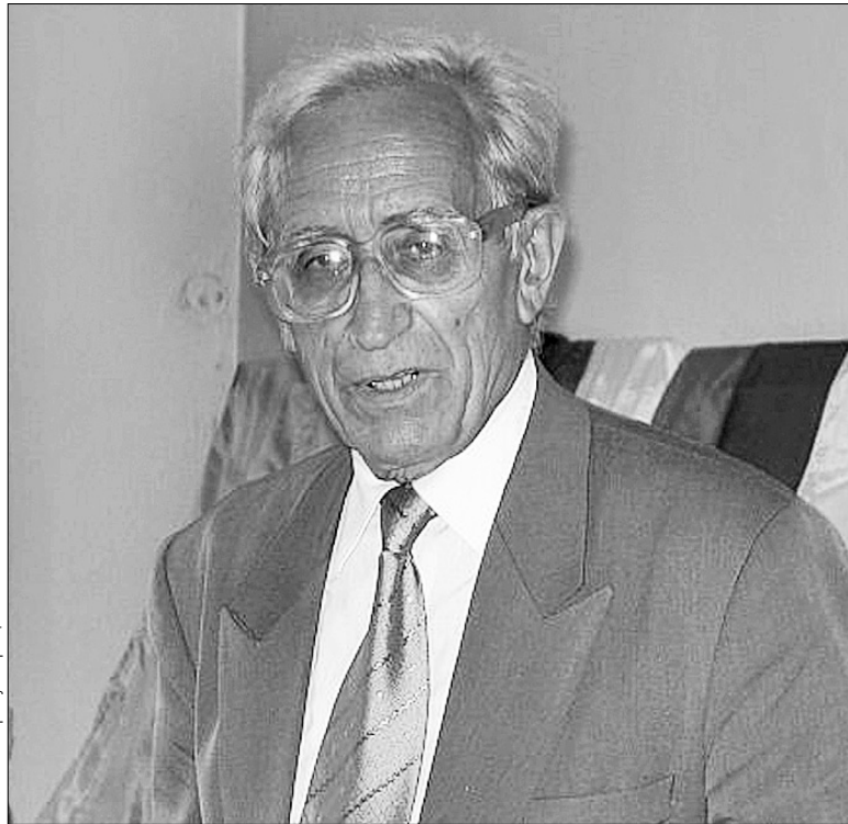
Іван Ющук автор понад двох десятків підручників, за якими викладають у школах, вишах

Чи не кожному школяреві та студентові в Україні відоме ім'я Івана Ющука. Саме він, нині 76-річний професор, є автором більшості підручників з української мови, затверджених Міністерством освіти і науки. Написав їх більш як двадцять. Нещодавно до книгарень надійшов також збірник вправ для тих, хто вивчає українську. Мову без помилок професор пропагує і на телебаченні. Веде передачу "Як ми говоримо". Пан Ющук пише також художні твори.