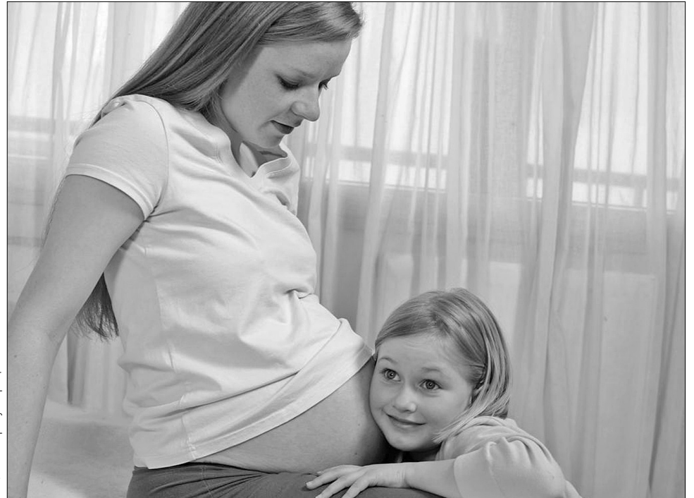
Леонід Черновецький вважає, що в період епідемії вагітні мешканки столиці не повинні боятися покарання роботодавців

«У нас із чоловіком практично немає родичів у Києві, а послуги няні нам не по кишені. Тому змушені залишати синочка самого вдома та йти на роботу, бо ж гроші заробляти треба. Часто телефоную, аби