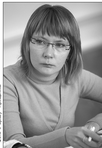
джено один випадок А/Н1N1 та три випадки грипу А у дітей.