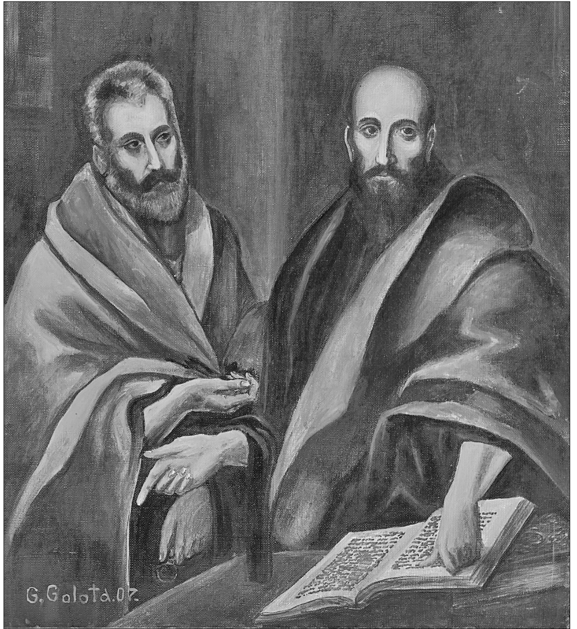
Апостоли Петр і Павел

Роботи, створені в студії, не полишають байдужим жодного глядача. Не маючи художнього досвіду, вони, як правило, копіюють відомих художників, запо-