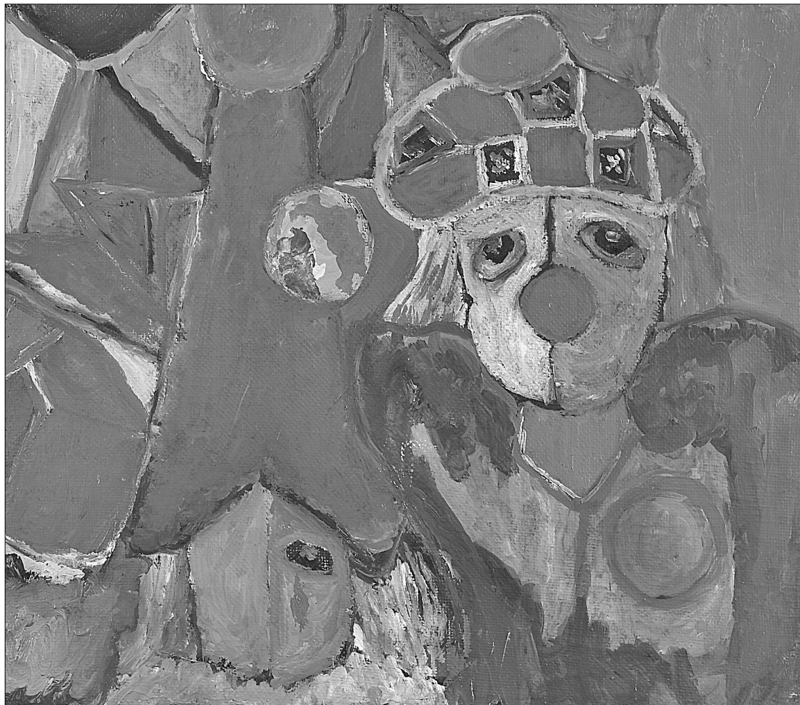
I ve never been clever

Всеукраїнський добродійний фонд "Соціальне партнерство" створено в 1998 році. Засновник — Леонід Черновецький. Фонд утворено з Християнського добродійного центру "Стефанія", реабілітаційного центру "Схід". Мета "Стефанії" — соціальна реінтеграція безпритульних громадян у суспільство до самостійного повноцінного життя. У "Стефанії" для безпритульних громадян працюють художня студія, їдальня, медпункт, майстерні з ремонту одягу і взуття, юрконсультація, відновлення документів, видають гуманітарний одяг, працює безплатний телефон, проводять духовну і соціальну роботу. У реабілітаційному центрі "Схід" проводиться немедикаментозне лікування всіх видів залежності. Центр функціонує з 2002 року. У Центрі діє чоловічий стаціонар. Програма реабілітації розрахована на 6 місяців. З дня заснування Центру реабілітацію пройшло приблизно 500 осіб, 48 % з яких позбулися наркозалежності назавжди.