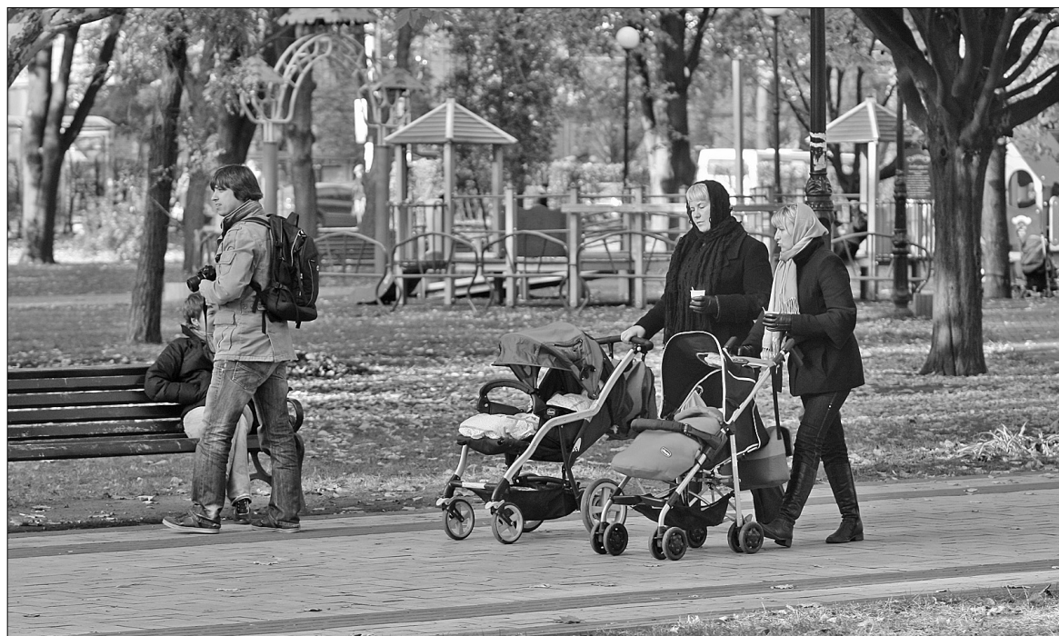
Улюблене місце відпочинку киян — парк імені Миколи Островського, що на Солом'янській площі

Жителі довколишніх будинків часто приходять сюди подихати свіжим повітрям, та й перехожі не проти зупинитися і відпочити після важкого дня, посидіти на лавці. Мама з дітьми тут активно проводять час. Багатьом це