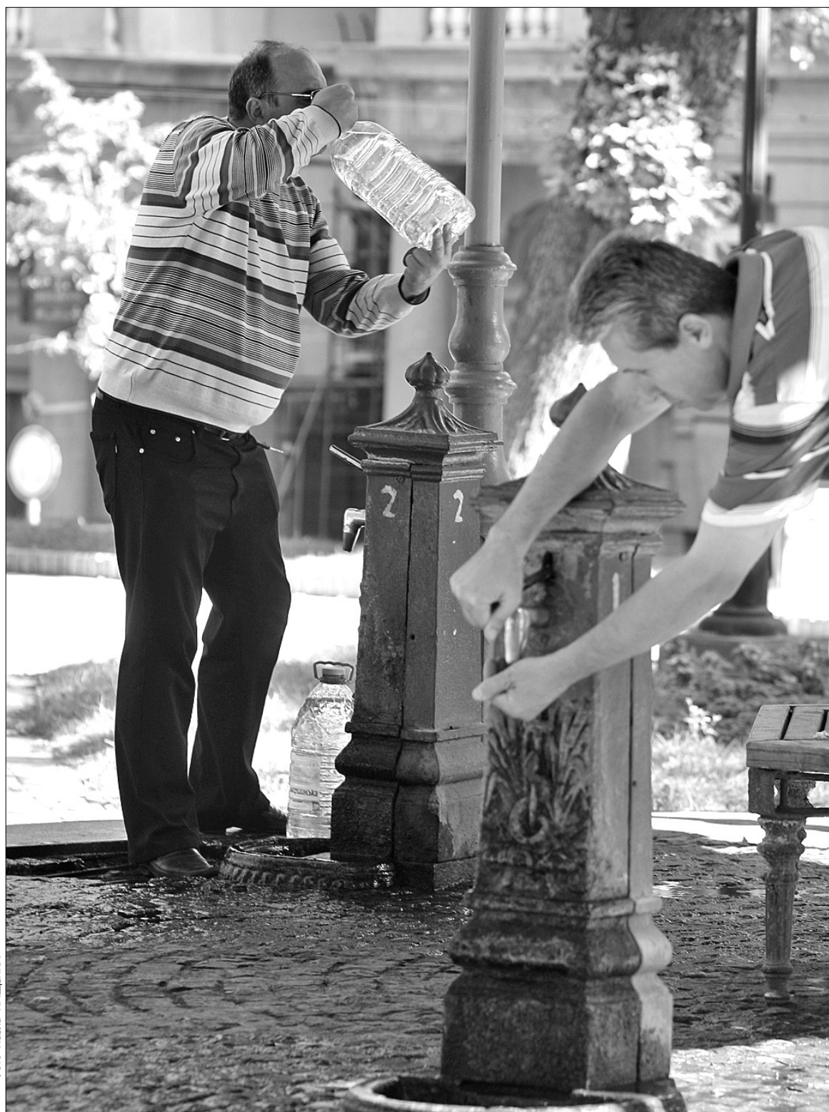
Нині у Києві налічується приблизно дві сотні бюветів