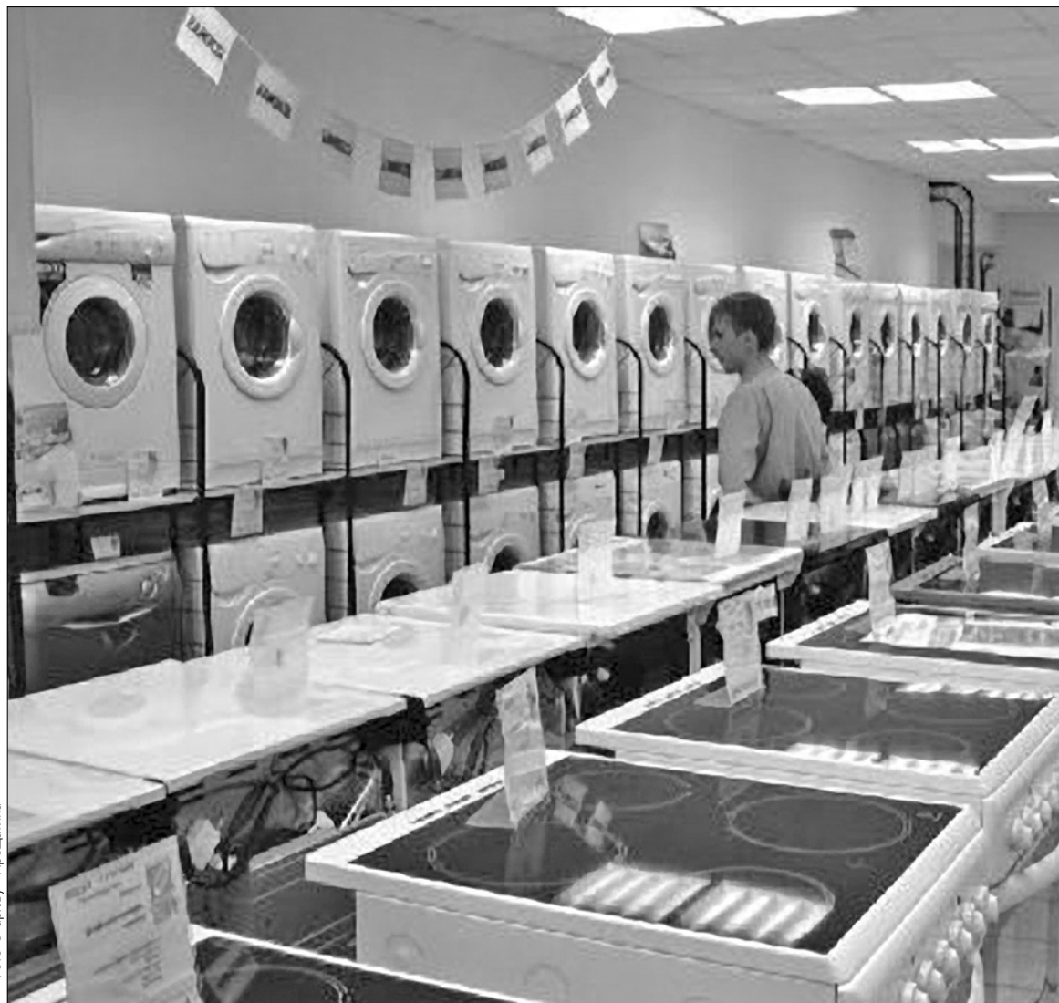
Споживач має право обміняти непродовольчий товар належної якості на аналогічний у продавця, в якого був придбаний

Якщо на момент обміну аналогічного товару немає у продажу, споживач має право або придбати будь-які інші товари з наявного асортименту з відповідним перерахуванням вартості, або розірвати договір та одержати назад гроші у розмірі вартості повернутого товару, або обміняти товар на аналогічний