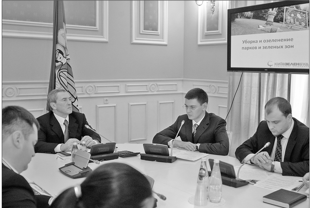
Мер Леонід Черновецький узяв прибирання міських парків під особистий контроль

Учора мер Леонід Черновецький провів нараду з приводу озеленення, прибирання та благоустрою київських парків. “Я постійно отримую чимало скарг від киян на незадовільний стан парків та скверів, на проблеми з прибиранням. Розумію, що є об'єктивні причини, зокрема фінансові труд-