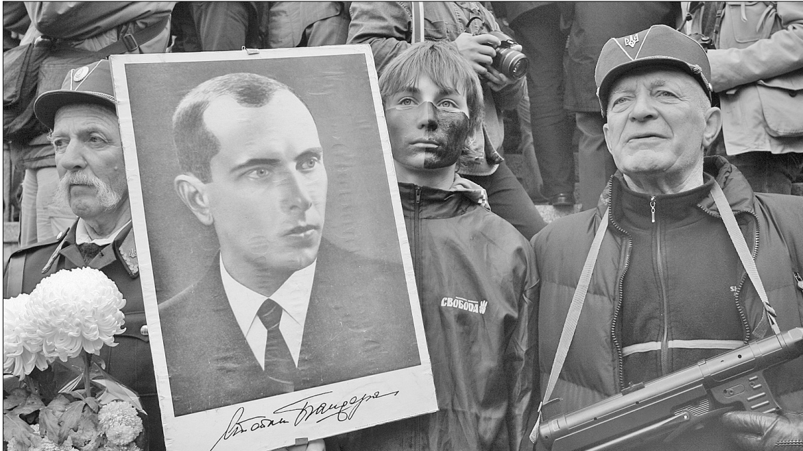
Цього року, окрім ветеранів, вшанувати пам'ять воїнів УПА до столиці прийшло багато молоді з усіх регіонів України