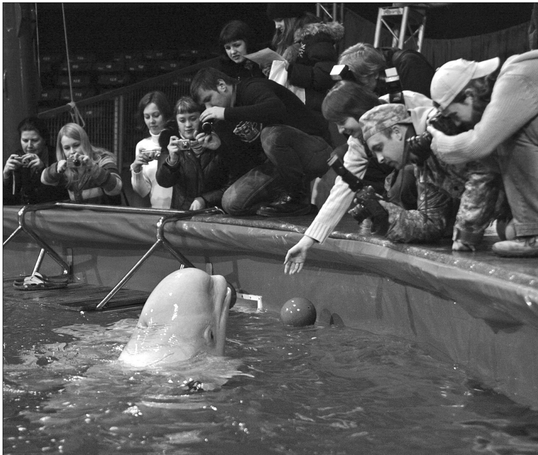
Через неправильні умови утримання та жорстокі тренування життя дельфінів у неволі скорочується у 6 разів

У містах-мільйонниках дельфінарії працюють лише з комерційною метою. “На волі дельфін пропливає за день 100—160 кілометрів та пірнає на глибину до 200 метрів. В дельфінарії він цього не може