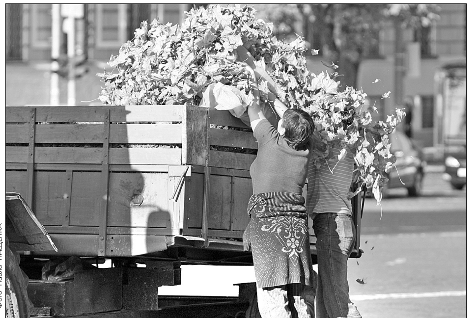
Кияни скаржаться, що замість належного вивезення сміття у столиці його почали масово спалювати