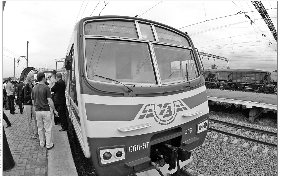
Пасажирів міської електрички збільшується з кожним днем — дістатися з Троєщини до Петрівки новий вид транспорту дає змогу за 30–40 хвилин

3 Подолу в будні дні катери відправлятимуться о 17.00, 18.20 і 19.40, а з Оболоні — о 17.40, 19.00 і 20.20. У вихідні дні трамваї курсуватимуть з 14.30 до 20.00. Дорога від Поштової площі до Оболоні займе півгодини. Згодом планують відкрити й маршрут із центру міста в бік Русанівських садів.