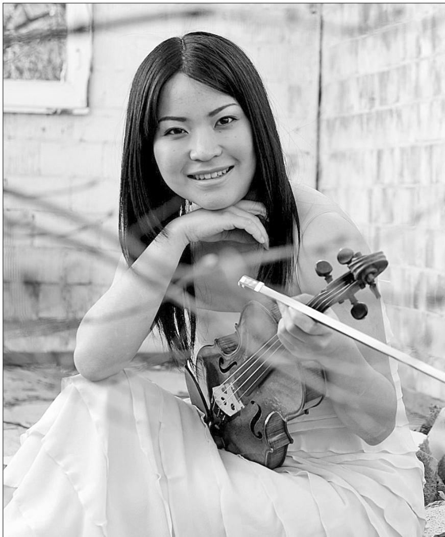
Стильові риси ігрової манери Маюко Каміо — стриманість і водночас прихована експресивність

Перший концерт нового сезону віддано філармонічному симфонічному оркестру під керівництвом Миколи Дядюри за участю юної японської скрипальки Маюко Каміо. Ця східна виконавиця раз уже відкривала сезон у київській філармонії (до слова, через рік після