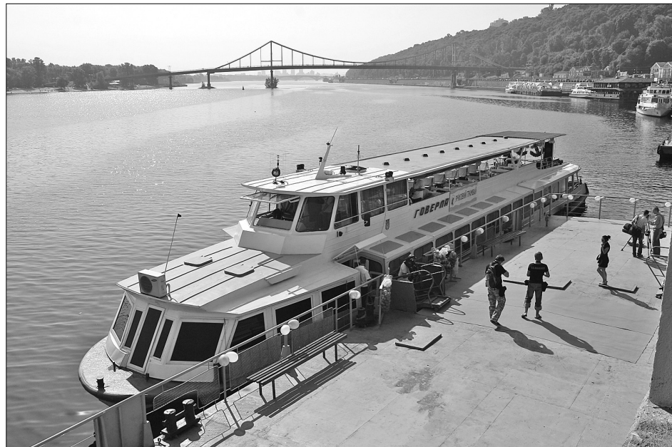
Відродженням річковим трамвайчиком найохочіше кияни користуються ввечері, дістаючись додому після роботи

Як показали "пробні заїзди", зранку попиту на маршрут із Подолу до Березняків практично немає, тому рейси віднедавна здійснюватимуть у вечірні години.