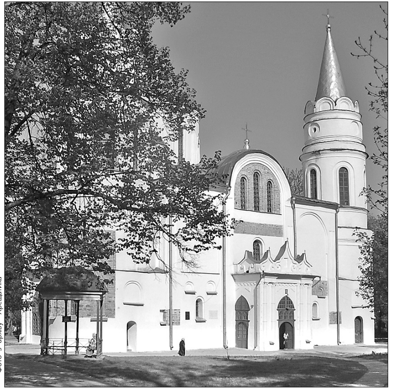
Спасо-Преображенський собор зберігся від епохи Київської Русі. Він дійшов до нас частково перебудованим після пожежі 1756 року. Тоді на обидві вежі було встановлено великі шпилі, що змінили вигляд церкви

Якщо ви вже затрималися у місті, то можна вирушити знайомитися з історичними місцями Чернігівщини. Є що подивитися у Батурині, Острі, Любечі, Седневі. Але це вже тема для іншої статті ●