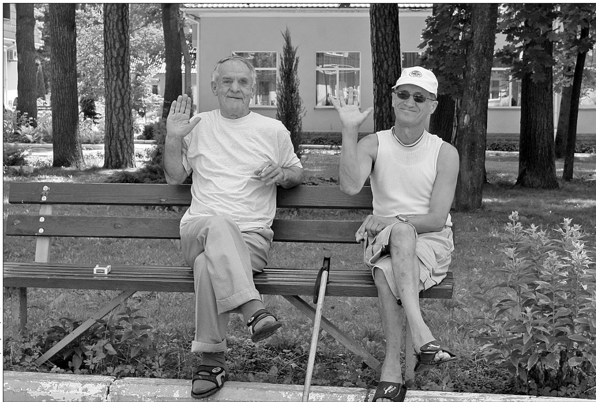
У “Кращому домі” пенсіонерам не бракує спілкування

Щоб запобігти цьому, київська влада і створила програму “Кращий дім”. Призначена вона для всіх літніх людей, які досягли пенсійного віку і хочуть змінити