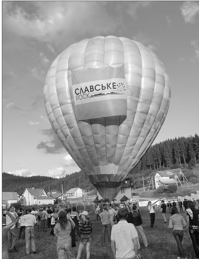
Минулого року гостей розважали польотами на повітряній кулі

На фестивалі працюватимуть творчі майстерні. Цього року за 10 днів до початку фестивалю розпочнеться Міжнародний симпозиум керамістів. Його учасниками стануть естонці, литовці, поляки, українці. Симпозиум проходитиме під назвою "Біле дерево". За 3 дні до фестивалю неподалік від головної сцени на острові працюватиме піч, в якій із суботи на неділю обпалюватимуть керамічні вироби, зроблені напередодні. Сам процес обпалювання — досить яскраве дійство. А в неділю відбудеться урочисте відкриття виставки керамічних виробів. Крім цього, протягом фестивалю керамісти проводитимуть майстер-класи з гончарства на