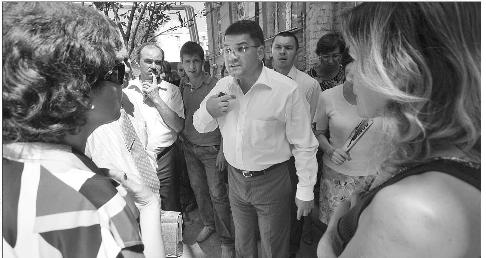
Депутат Кирило Куликов — частий гість на будівельних майданчиках

Учора керівники будівельної компанії ТОВ "Інвестиційно-будівельна група" заявили про рейдерську атаку, очолювану народним депутатом Кирилом Куликовим та звернулися до влади з проханням втрутитися в конфліктну ситуацію щодо будівництва на вулиці Олеса Гончара, 17–23. Будівельники звинувачують нардепа від "Народної самооборони" в потуранні злочинцям та в протиправних діях. Зокрема, у сприянні здирикам, які вимагають 5 мільйонів гривень за припинення протестів. Через конфлікт будівництво наразі "заморожено". Інвестори зазнають значних збитків.