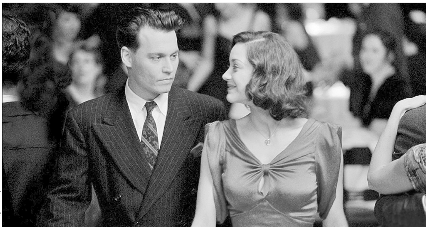
Кадр з фільму

Фільм Манна став уже шостим бойовиком, присвяченим найвидатнішому грабіжнику банків в історії Америки (а, отже, і всього світу). Із попередніх фільмів найвідомішим є “Діллінджер” 1973 року Джона Міллуса (режисера “Конана-Варвара” і співавтора сценарію до “Апокаліпсису сьогодні”), який і досі залишається еталоном постановки сцен з перестрілками. Проте автори “Джонні Д.” обіцяють надати історії не лише справжнього голлівудського розмаху (бюджет фільму — $ 80 млн), а й найточнішу відповідність реальним фактам. Літературним першоджерелом фільму стала монографія Браяна Барроу “Вороги суспільства: найбільша хвиля злочинності в Америці й поява ФБР, 1933–34”, оперативно перекладена російською мовою. Майкл Манн і Джонні Депп не обмежилися прочитанням книжки, вони самостійно попорпалися в поліцейських архівах і бібліотеках,